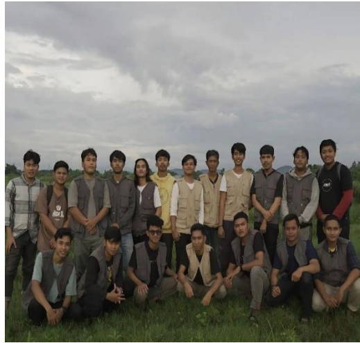
Kegiatan magang Vestanesia