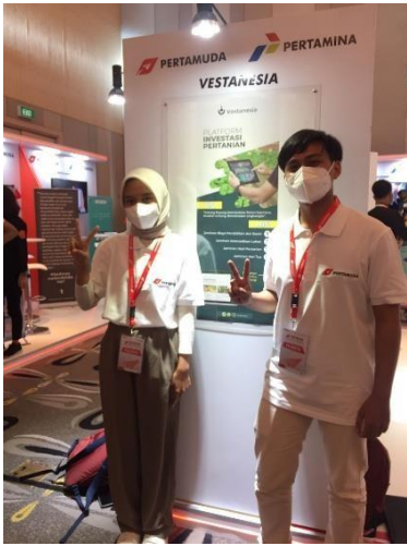
Pertamuda Seed & Scale 2022 di Jakarta Pusat