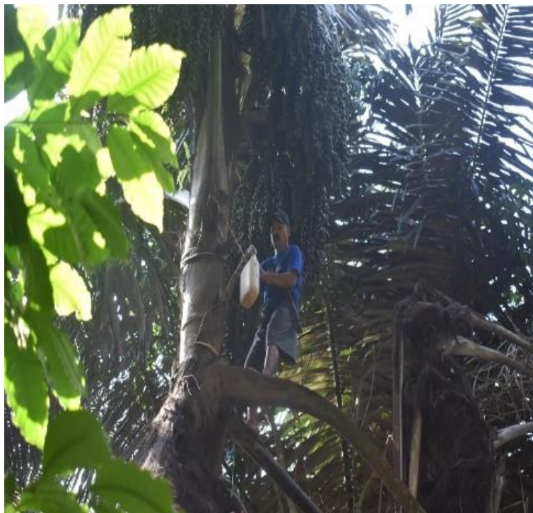
Gambar 2. Proses Pemanenan Nira