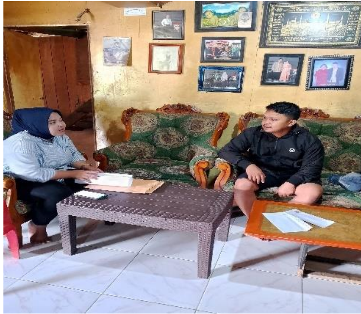
Gambar 1. Wawancara Responden