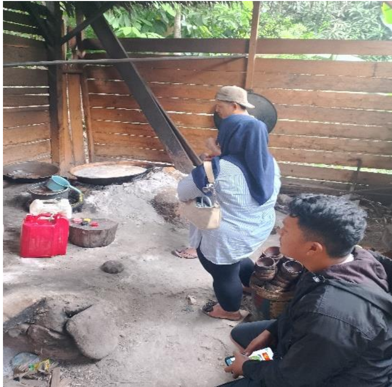
Gambar 3. Proses Pemasakan Nira Aren