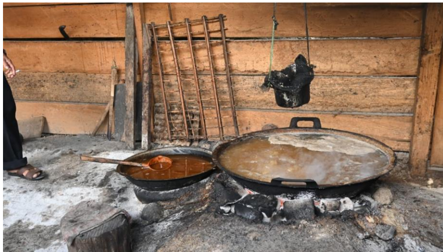
Gambar 4. Proses Pembuatan Gula Aren