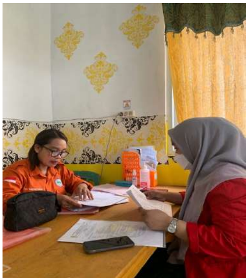
BIDAN PENANGGUNG JAWAB PELAYANAN KB