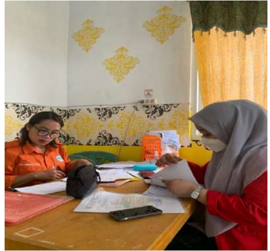
BIDAN PENANGGUNG JAWAB PELAYANAN KB