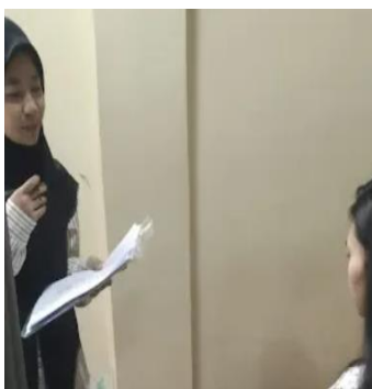
Wawancara mengenai faktor resiko lainnya yang dapat berpengaruh pada variabel penelitian