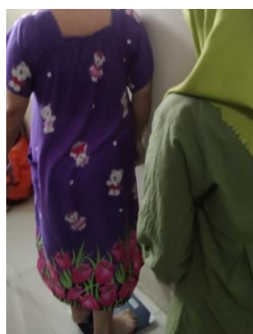
Pengukuran Tinggi dan Berat Badan Responden di Rumah Responden