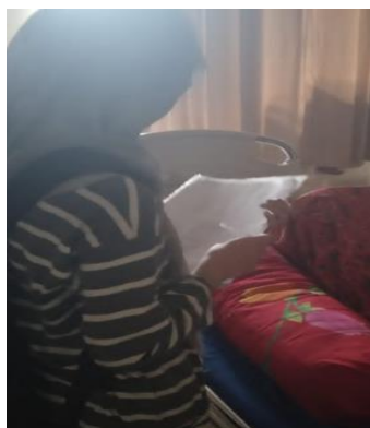
Responden menandatangani lembar informed consent