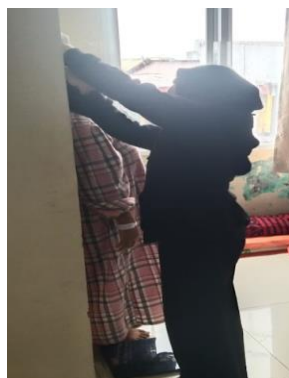
Pengukuran Tinggi dan Berat Badan Responden di RSKDIA Siti Fatimah