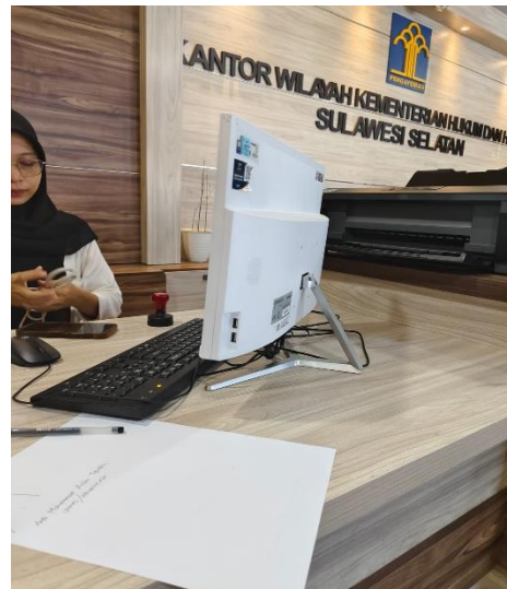
Gambar 1.4. Gambar Kantor Wilayah Kementerian Hukum dan HAM Sulawesi Selatan