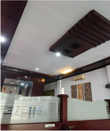
Gambar 1.7. Gambar Kantor Notaris Fatmawaty Noor