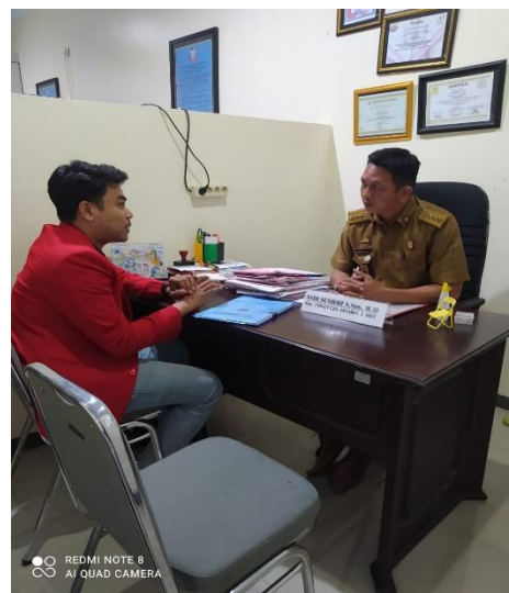
Gambar 1.6. Wawancara Staff DISNAKER Kota Makassar