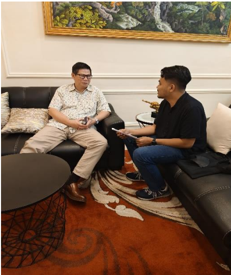
Gambar 1.3. Dokumentasi wawancara Ketua Pengurus Daerah Makassar Ikatan Notaris Indonesia