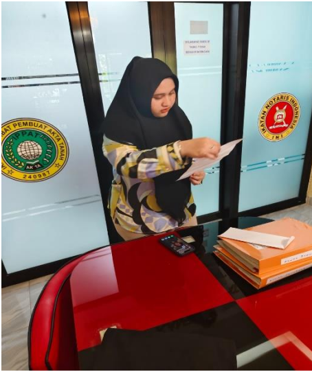
Gambar 1.9. Dokumentasi wawancara Staff Notaris