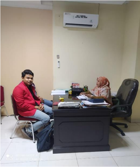
Gambar 1.8. Dokumentasi wawancara Kepala Bagian Hukum Sekretariat Daerah Makassar