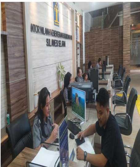
Gambar 1.5. Dokumentasi wawancara Staff bagian Hukum KEMENKUMHAM