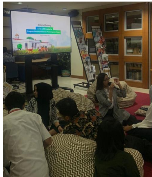
Kegiatan Kunjungan STIA LAN Jakarta di Kemensetneg