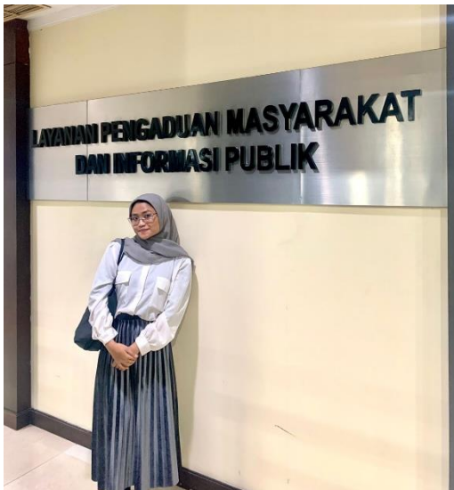
Kantor layanan di Gedung Sayap Timur Kemensetneg