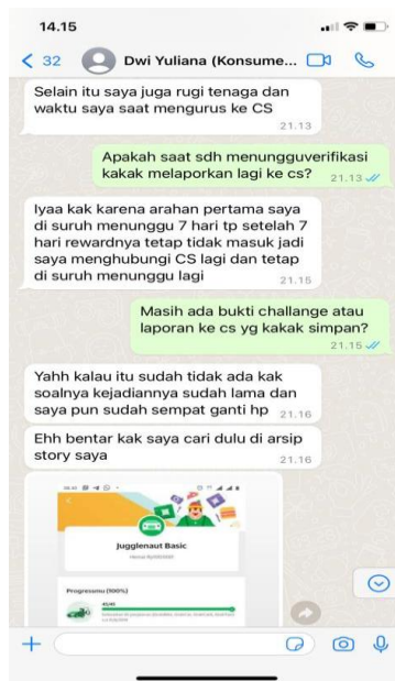
Gambar 3. Wawancara dengan Dwi Yuliana, pengguna jasa yang mengikuti Challenge Juggernaut Basic . Dilaksanakan melalui Chat Whatsapp , 5 Juli 2023