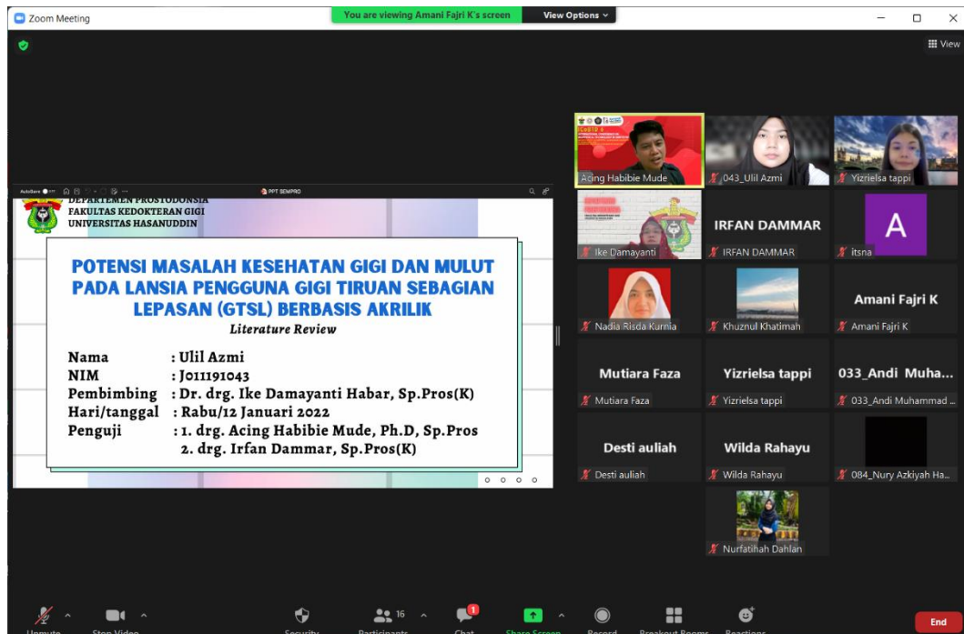
Seminar Proposal / Ujian 1