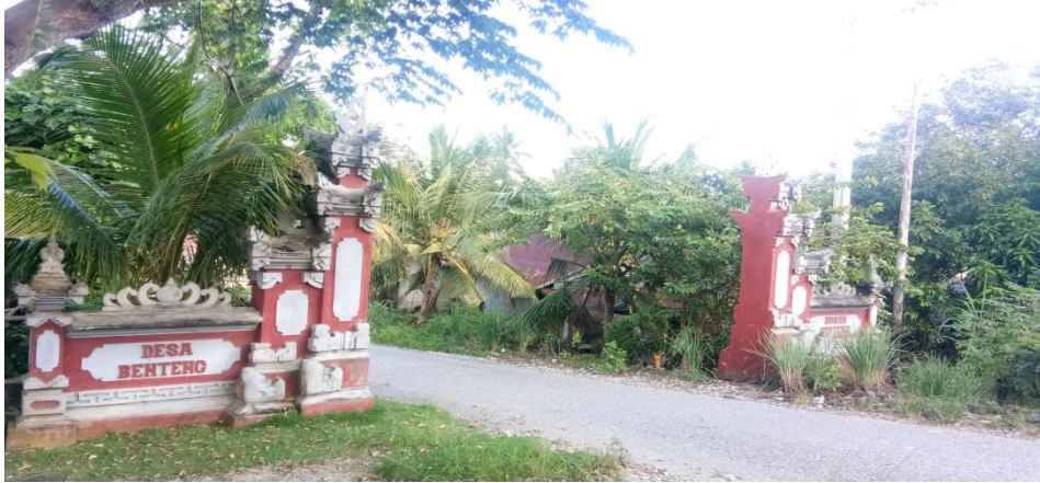
Gambar 2. Gapura pintu masuk Desa Benteng