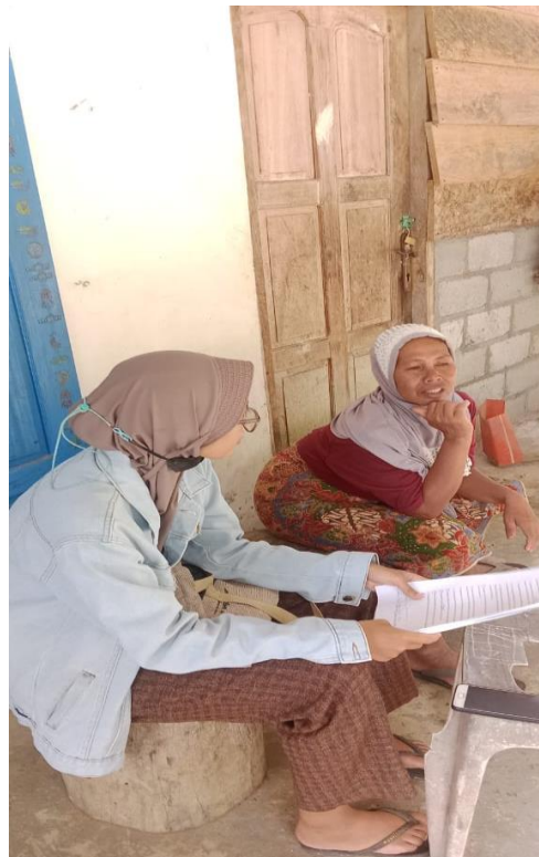
Gambar 6. Wawancara Suku Sasak