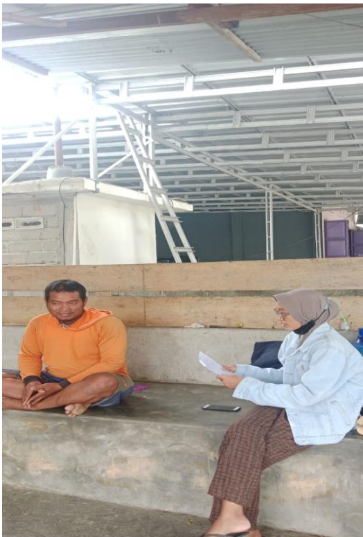
Gambar 5. Wawancara Suku Bali