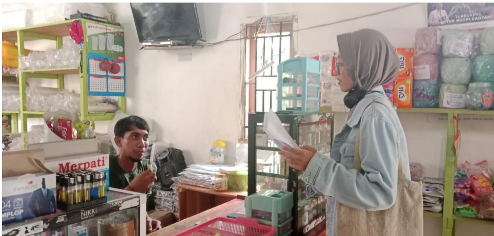
Gambar 3. Wawancara Suku Bugis