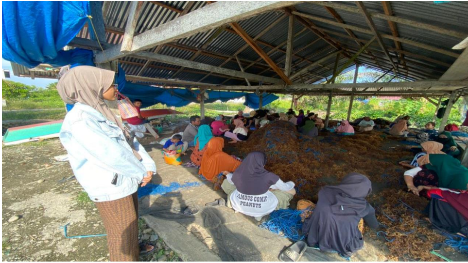
Gambar 4. Wawancara kelompok pekerja perempuan Sasak