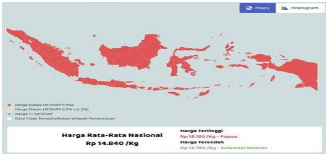
Sumber: Pusat Informasi Harga Pangan Strategis Nasional (PIHPSN) 2023