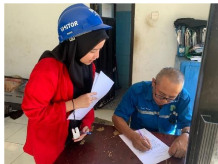
Pengisian Kuesioner, Wawancara dan Observasi