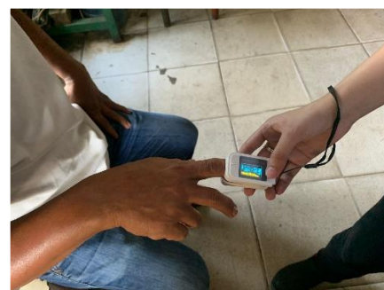
Pengukuran Beban Kerja