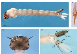
Gambar 1. 1 Aedes aegypti . (a) Tampak seluruh punggung larva instar 4, (b) sisik sikat (comb scale) yang seperti garpu rumput, (c) Tampak belakang kepala, (d) Tampak segmen lateral.

Karakteristik dari jentik Aedes aegypti juga di dalam air dapat bergerak dengan lincah dan aktif ke permukaan mengambil untuk udara nafas kemudian kembali lagi ke bawah, jika istirahat jentik terlihat tegak lurus dengan permukaan air dan posisinya membentuk 450 (KKP Kelas I Makassar, 2022).