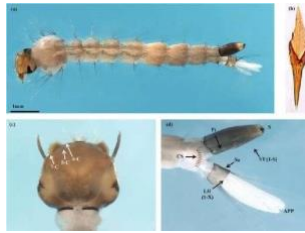
Gambar 1. 2 Aedes albopictus . (a) Tampak seluruh punggung larva instar 4, (b) sisik sikat (comb scale) yang seperti duri, (c) Tampak belakang kepala, (d) Tampak segmen lateral.

rambut, Hidup dan berkembang di kebun dan semak-semak (KKP Kelas I Makassar, 2022).