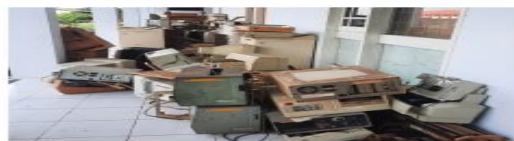
Lampiran I untuk gambar obyek lelang