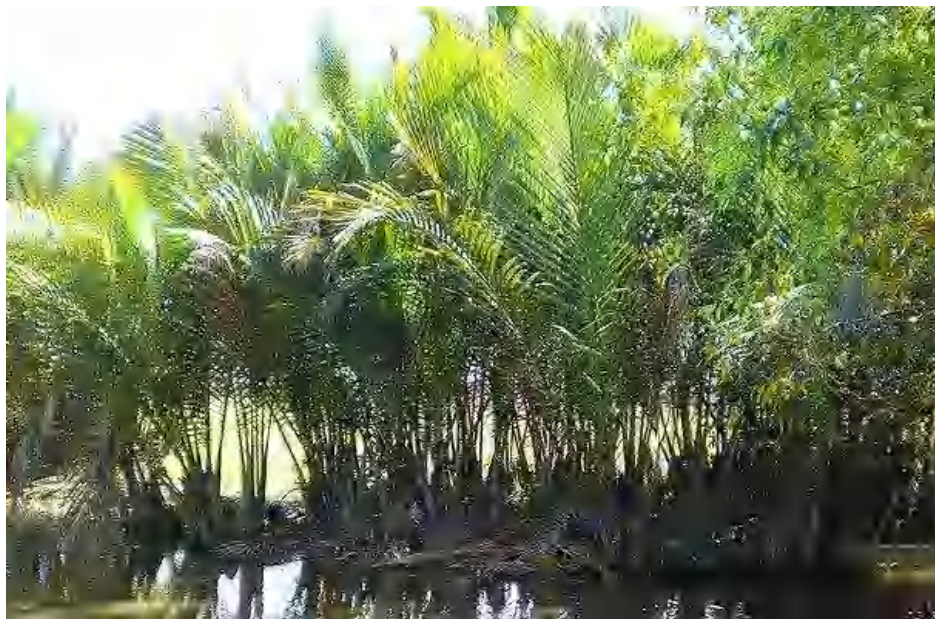
Gambar 3. Tumbuhan Nipah (Dinas Pertanian Mesuji, 2015).

permukaan laut. Lebar jalur pertumbuhannya mencapai 50-500 meter dari tepian sungai (Suharto, 1991). Tumbuhan Nypa fruticans hidup secara berumpun, di Indonesia banyak ditemukan di sepanjang pantai Sumatera dan Kalimantan. Jenis palma ini umumnya berhabitat di daerah payau dan tanah berlumpur serta dipengaruhi oleh pasang surutnya air laut dan air sungai (Rachman dan Sudarjo, 1991).