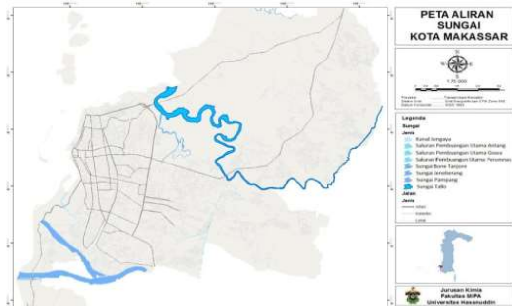
Gambar 1. Peta Sungai Tallo Makassar

besar yakni, Sungai Jenneberang dan Sungai Tallo serta kanal dan drainase kota yang semuanya bermuara di perairan pesisir Kota Makassar (Setiawan, 2014).