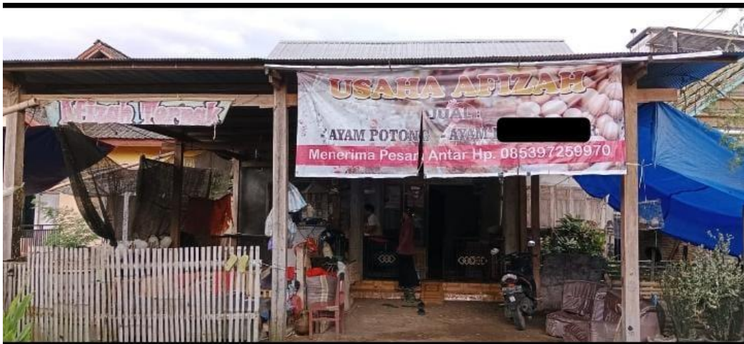
Gambar 10. Promosi menggunakan Banner