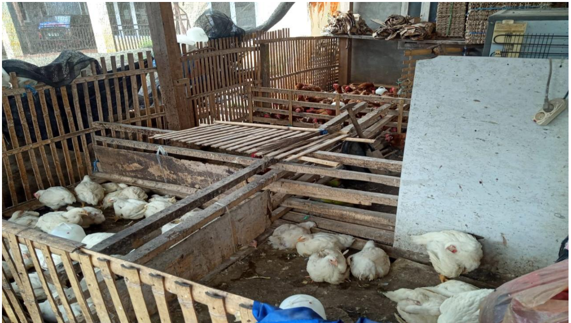
Gambar 7. Lokasi penjualan di rumah UD. Afizah