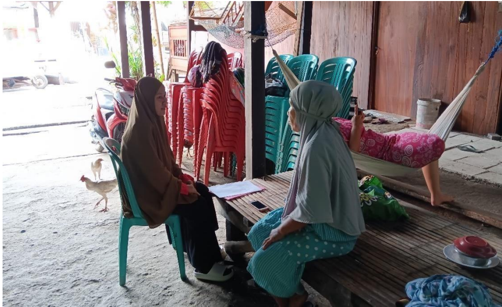
(Masyarakat sekitar hutan kota Batili)