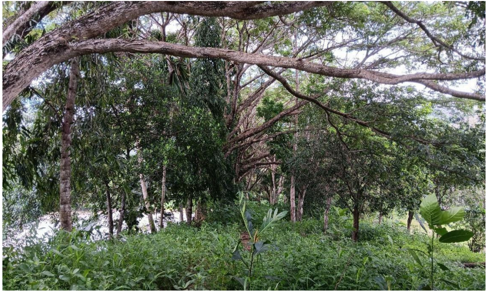
(RTH Hutan kota Batili)