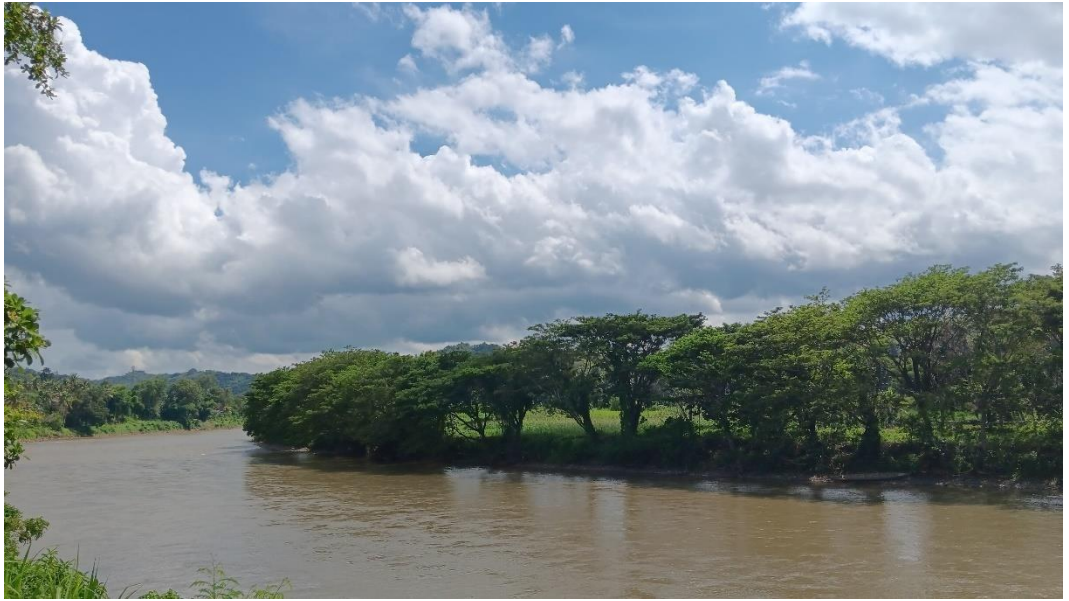
(RTH Hutan Kota Delta Sungai Saddang)