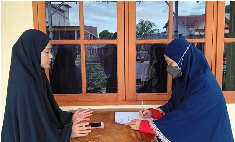
(Masyarakat wilayah Kota Enrekang)