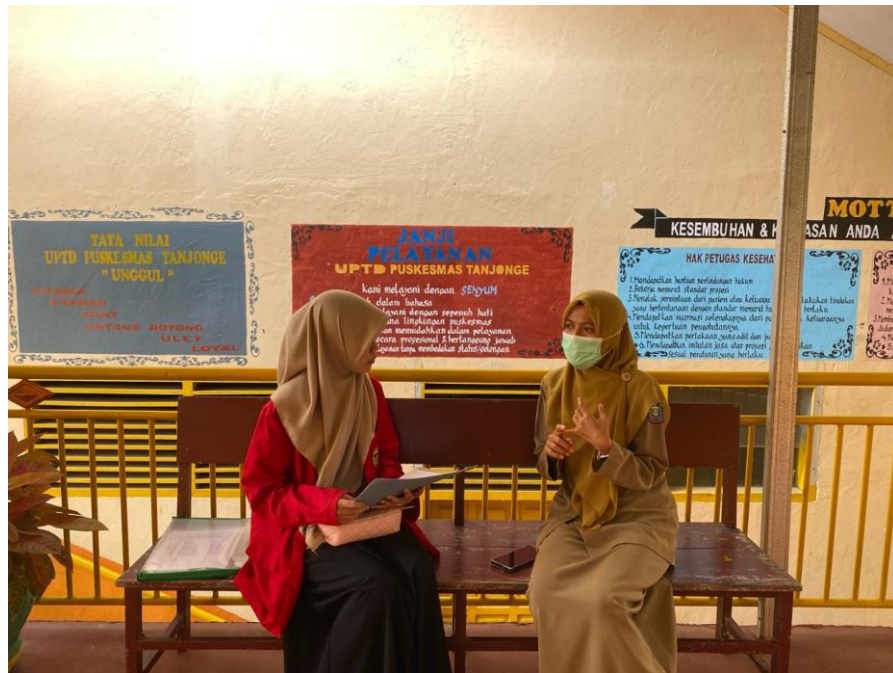
Dokumentasi wawancara dengan informan selaku Perawat UGD Puskesmas Tanjonge