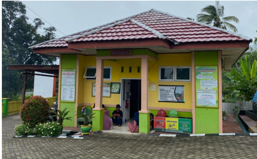
Gedung UGD Puskesmas Tanjonge