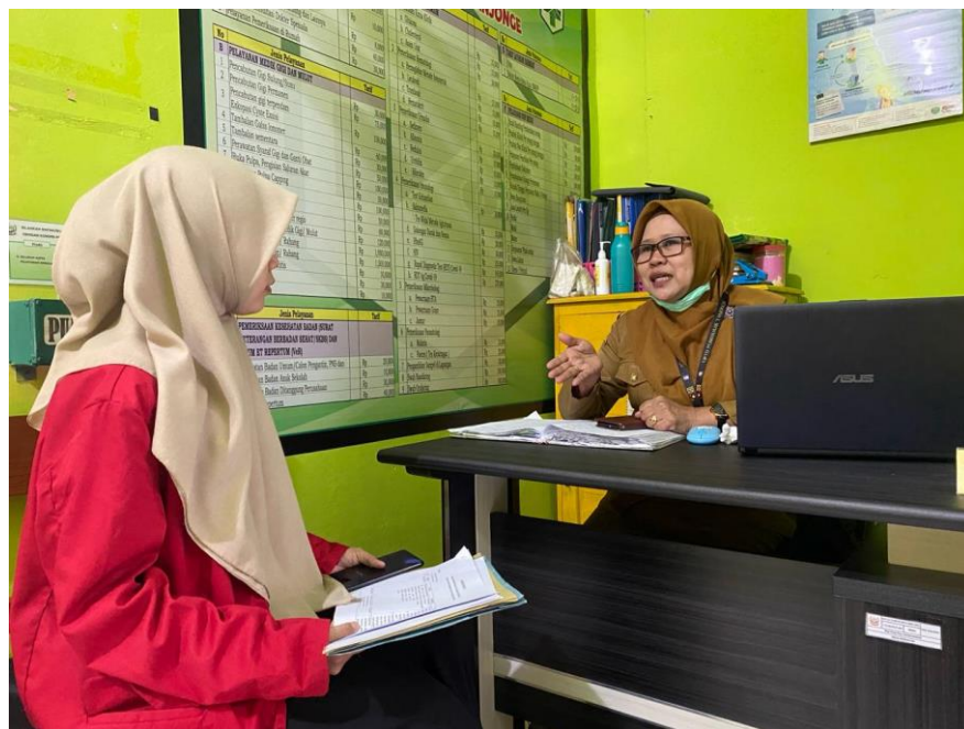
Dokumentasi wawancara dengan informan selaku pegawai di pendaftaran loket puskesmas tanjonge