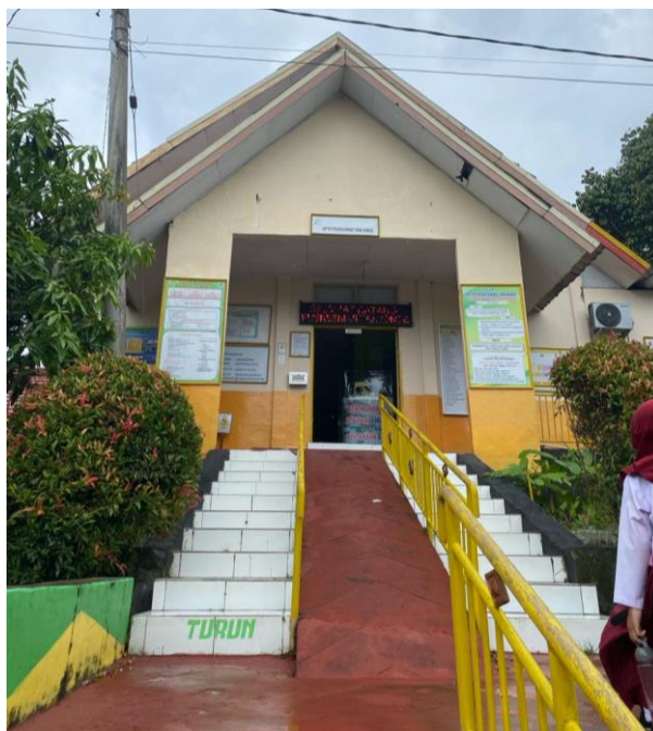
Gedung Poli Puskemas Tanjonge