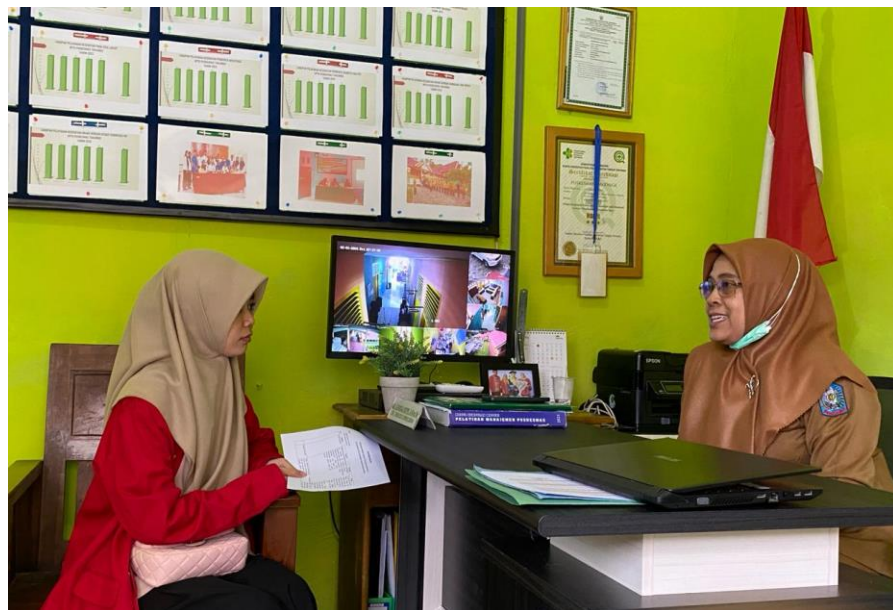
Dokumentasi Wawancara dengan informan selaku Kepala Puskesmas Tanjonge Kabupaten Soppeng