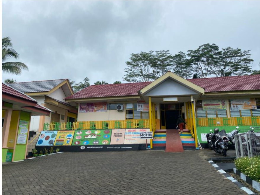
Gedung Perawatan Puskesmas Tanjonge