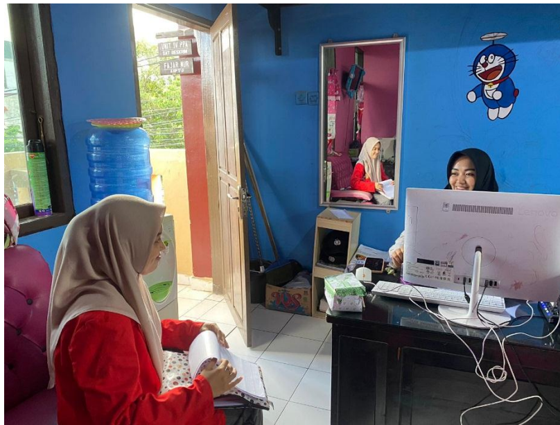
Wawancara Forum Anak Soppeng Latemmamala