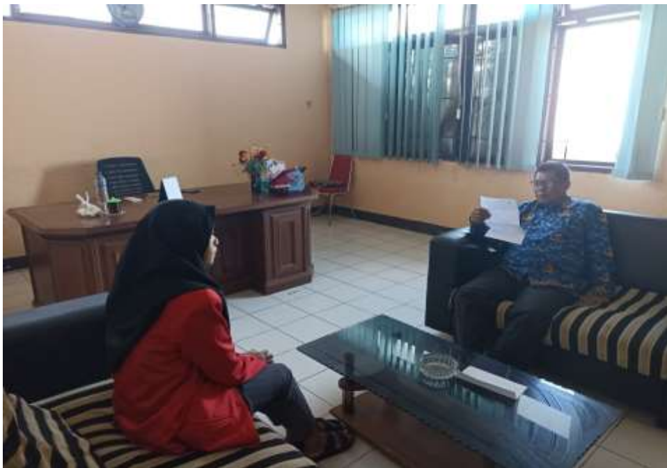
Membawa Surat Izin Penelitian