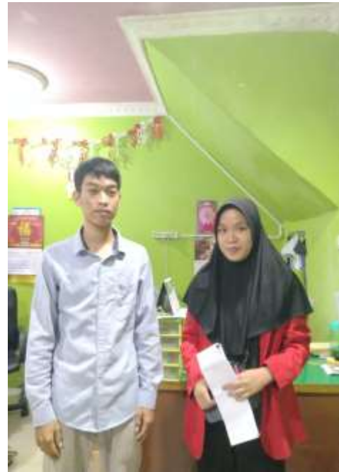
Foto Bersama Responden