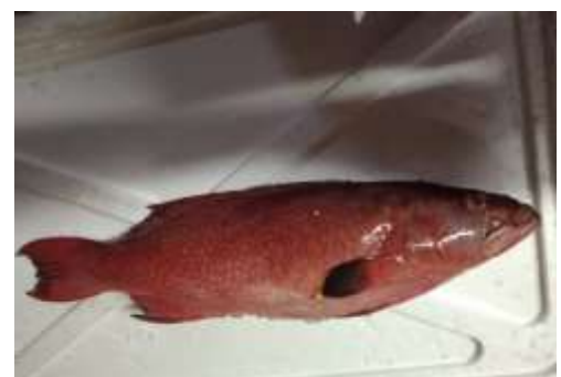
Foto Ikan Kerapu Sunu