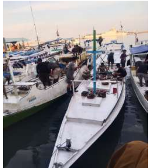
Kapal Penangkapan Ikan Kerapu Sundu