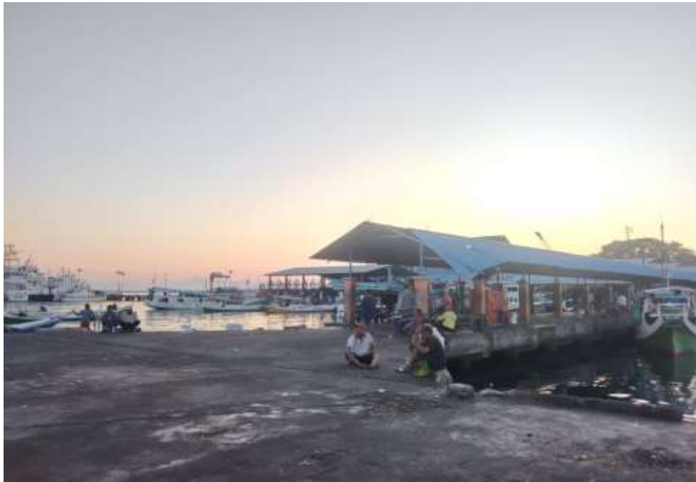
Dermaga PPI Paotere