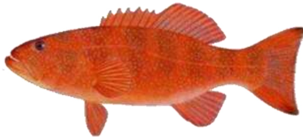
Gambar 1. Ikan Kerapu Sunu (Effendi, 2004)

Ikan merupakan sumber pangan hewani yang sudah tidak asing lagi di masyarakat. Jenis ikan merupakan bahan pangan sumber protein hewani yang relative murah dibandingkan dengan sumber protein hewani lainnya. Disamping menyediakan protein hewani yang relatif tinggi jumlahnya, ikan juga mengandung asam lemak tak jenuh, berbagai macam vitamin dan mineral yang sangat diperlukan oleh tubuh (Auliyah S. et al., 2016).