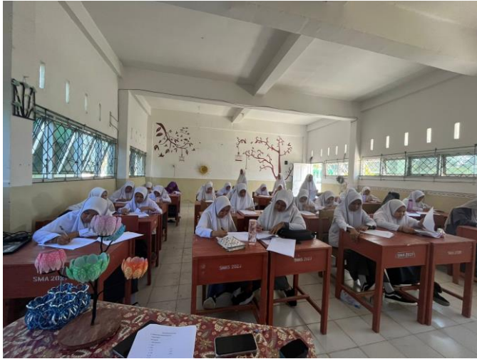
Gambar 4.4 Pengisian Kuesioner oleh Responden