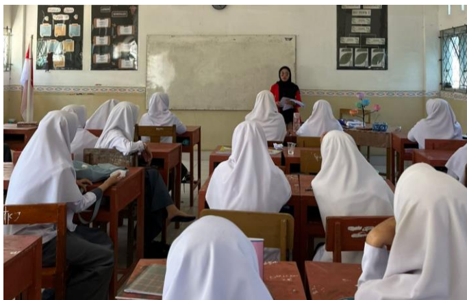
Gambar 4.3 Pemberian Arahan Mengisi Kuesioner