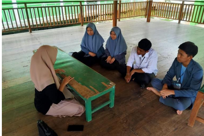
Gambar 4.1 Survei awal dengan OSPI