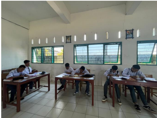
Gambar 4.5 Pengisian Kuesioner oleh Responden