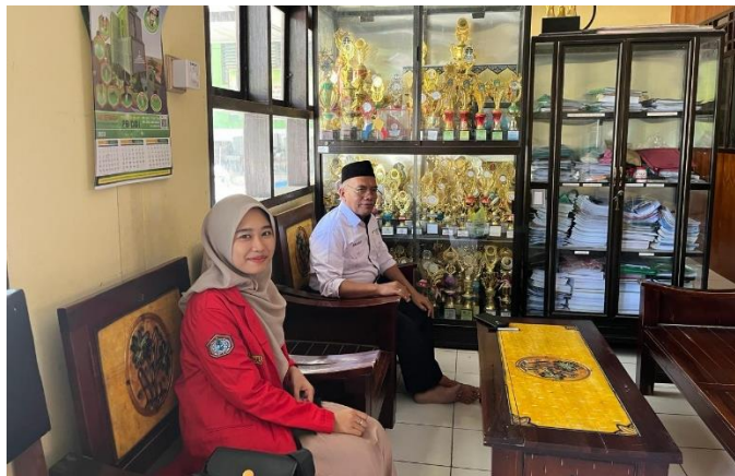
Gambar 4.2 Menyampaikan Surat Izin Penelitian