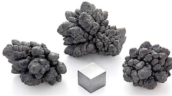
Gambar 1. Logam Timbal (Pb) (Riani, 2012)

timbal tetra etil (TEL), timbal tetra metil (TML), dan timbal stearat (Palar, 2012). Logam timbal dapat dilihat pada Gambar 1.