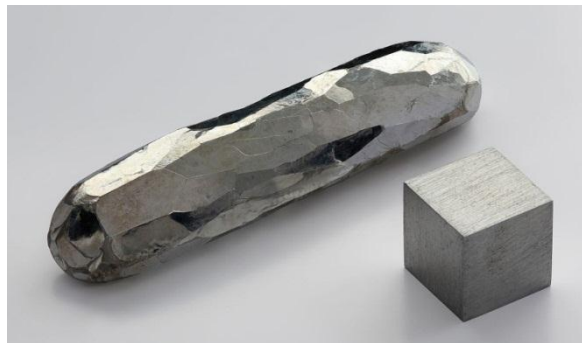
Gambar 2. Logam Kadmium (Cd)

Kadmium (Cd) merupakan logam berbentuk agak lunak dan berwarna metal biru-putih seperti merkuri dan seng. Logam ini memiliki nomor atom 48, berat atom 112,4 g/mol, berat jenis 8,65 g/cm 3 , titik didih 767 °C, titik leleh 321 °C (Handayanto dkk., 2017). Dua dari delapan isotop Cd bersifat radioaktif yaitu 113 Cd dan 116 Cd. Rata-rata konsentrasi kadmium pada kulit bumi adalah antara 0,1 dan 0,5 ppm. Kadmium memiliki sifat larut dalam asam kuat seperti HCl dan H 2 SO 4 , tidak larut dalam basa, serta dapat bereaksi dengan unsur non logam dan halogen (Muliari, 2019). Logam kadmium (Cd) dapat dilihat pada Gambar 2.