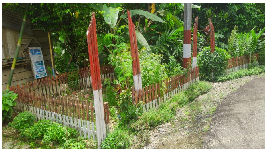
Tanaman obat keluarga di kelurahan Latuppa