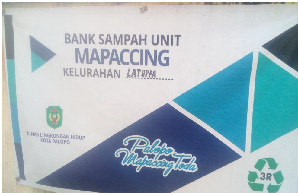
Bank Sampah Kelurahan Latuppa