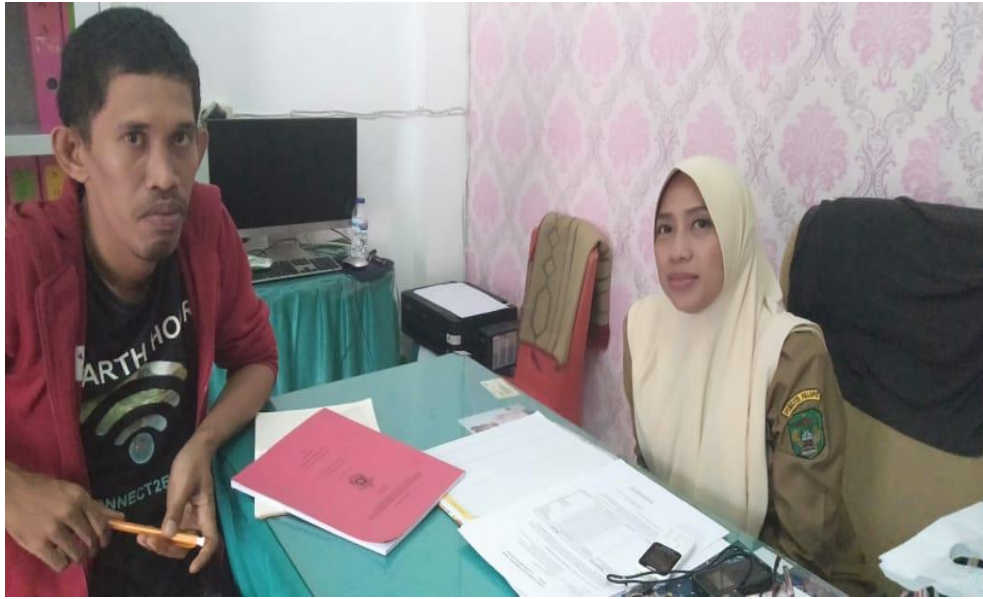
Wawancara dengan staff puskesmas Mungkajang