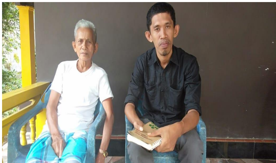
Wawancara dengan tokoh masyarakat Latuppa