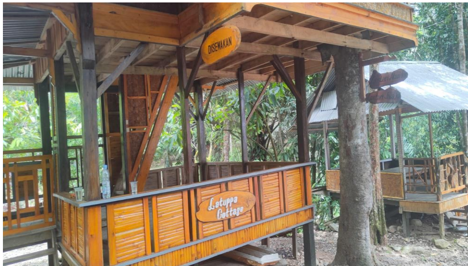
Gazebo di kelurahan Latuppa