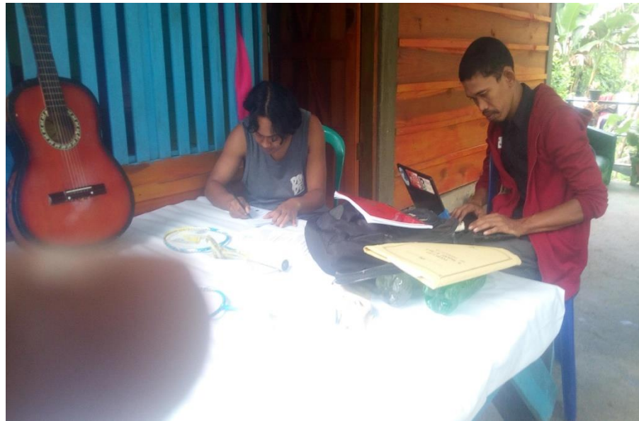
Wawancara dengan tokoh pemuda Latuppa