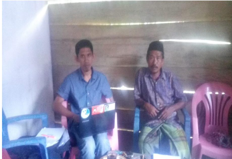
Wawancara dengan ketua Direktur Bank sampah Latuppa