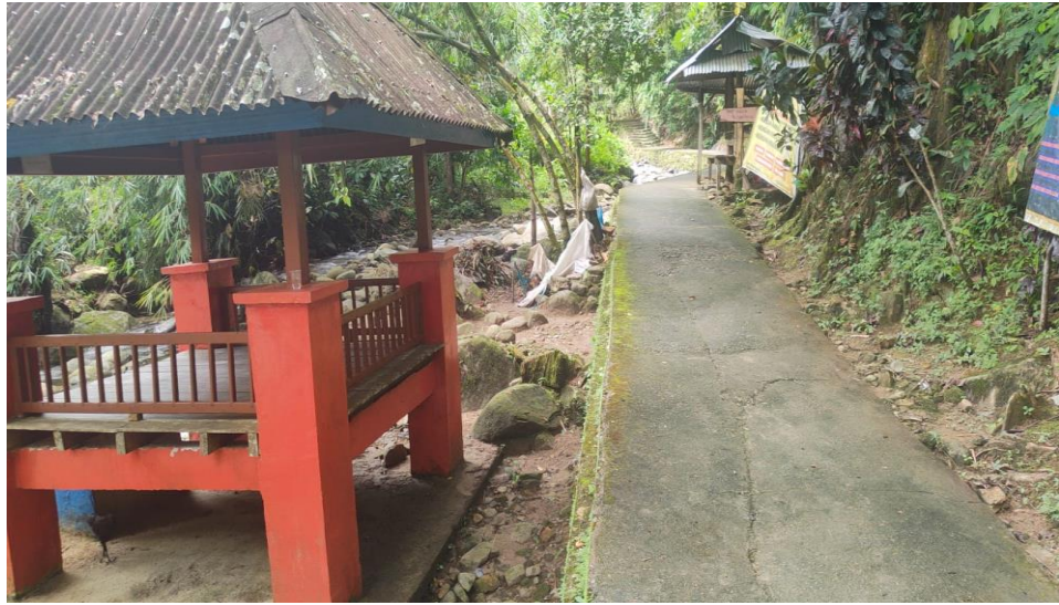
Jalan menuju lokasi air terjun Latuppa