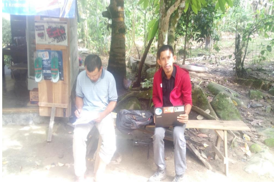
Wawancara dengan ketua RW