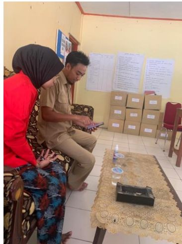
Pengambilan data dan profil Desa Cabbeng (dokumentasi pada tanggal 16 November 2022).