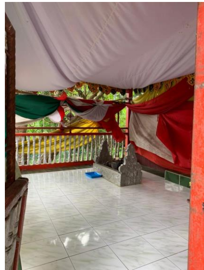
Makam Petta Tanre Wara (Dokumentasi 20 November 2022).