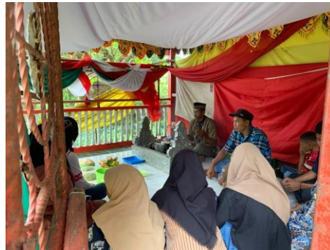
Pelaksanaan tradisi Menre'Coppo' Bulu (ritual ma' baca-baca ) yang di pandu oleh sanro (Dokumentasi 20 November 2022).