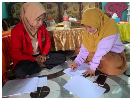
Pengisian kuesioner oleh responden (dokumentasi pada tanggal 19 November 2022).