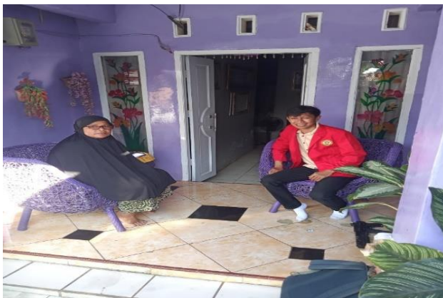
Wawancara Informan SR