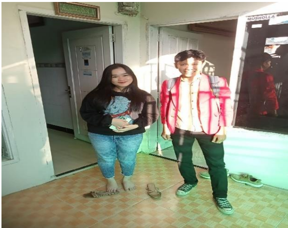
Wawancara Informan MK