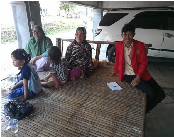
Wawancara Informan HDM