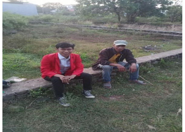
Wawancara Informan IR