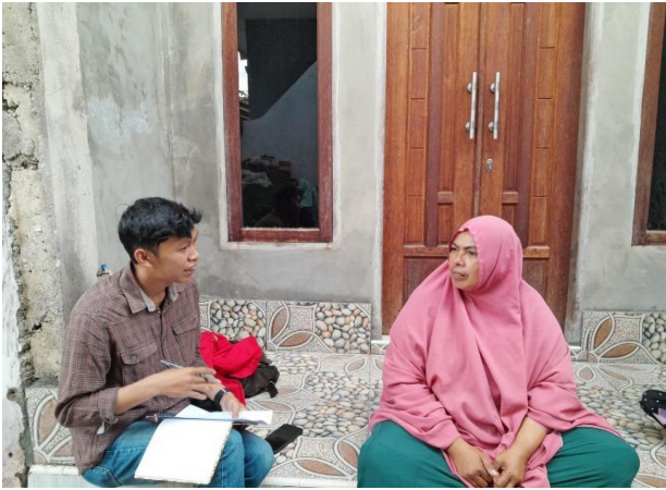
Wawancara Informan HDB