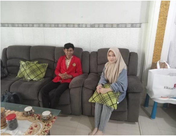
Wawancara Informan MSD