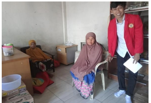
Wawancara Informan MDM dan DN