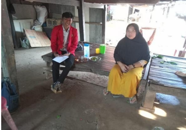
Wawancara Informan HB