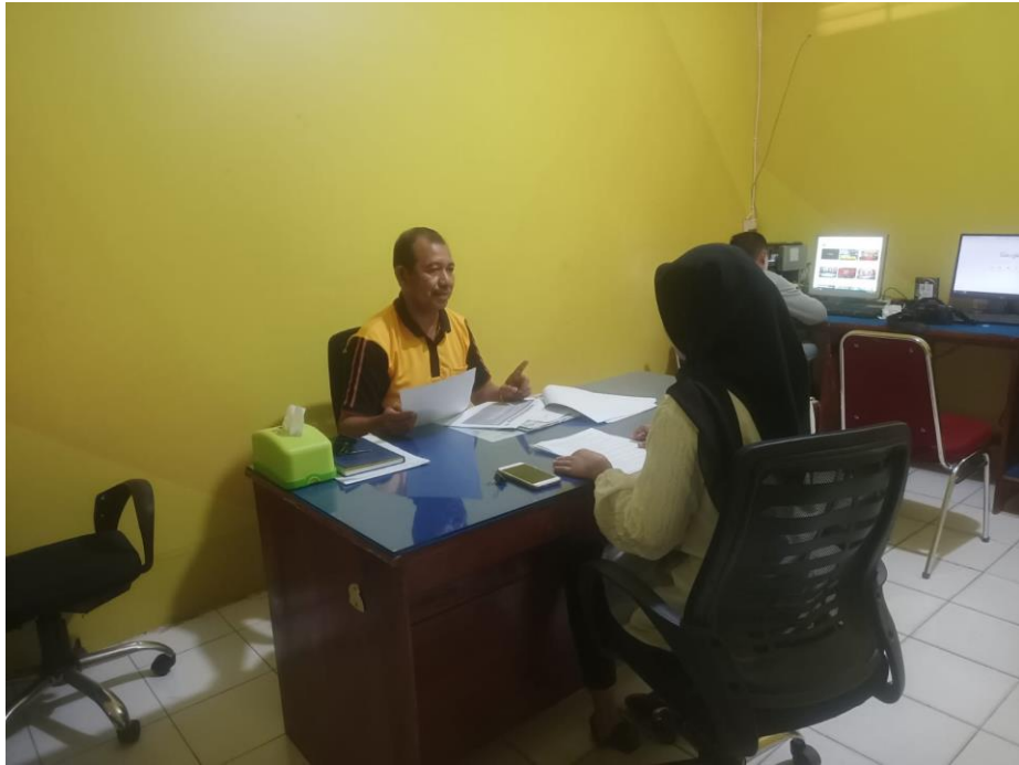
Wawancara dengan Informan I