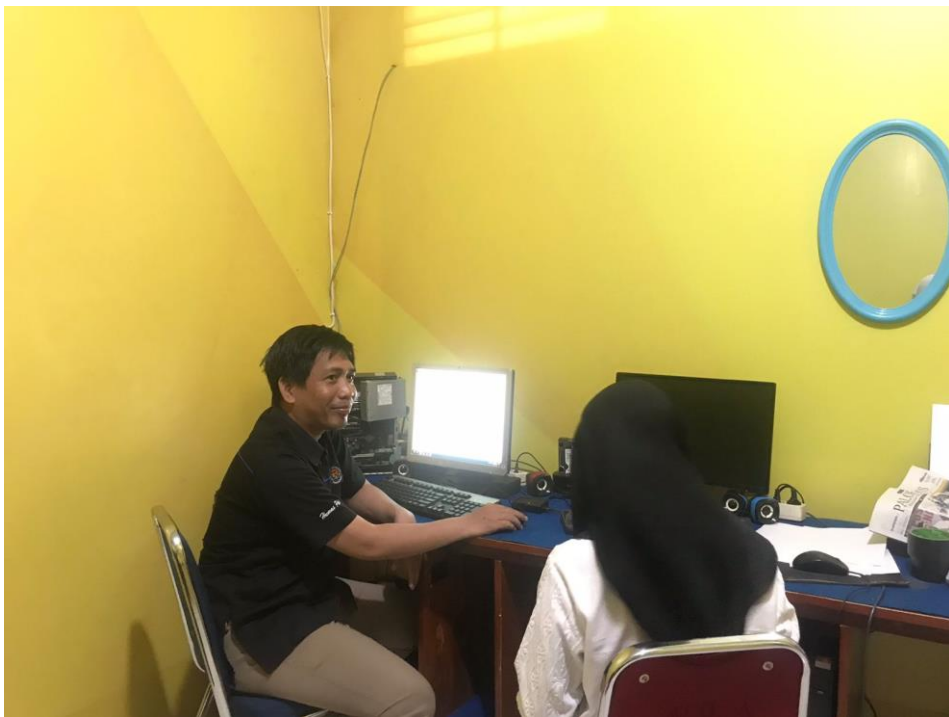
Wawancara dengan Informan II