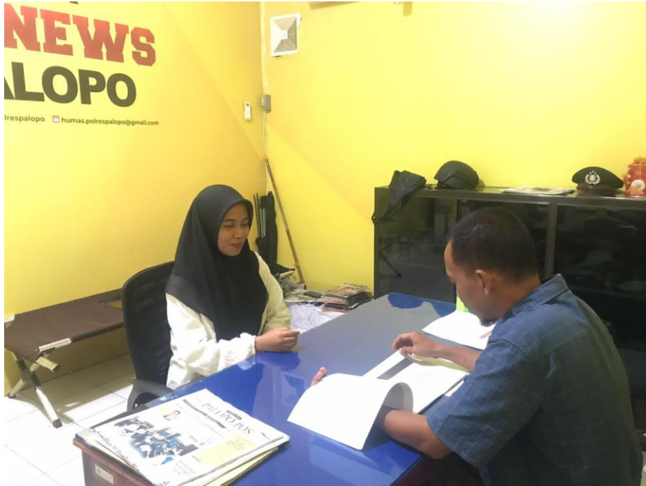
Wawancara dengan Informan III