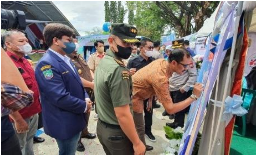
Penandatanganan Kerjasama Aktor