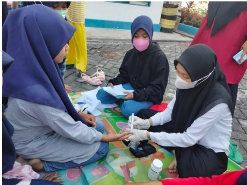
Pemeriksaan Darah Oleh Tim Puskesmas