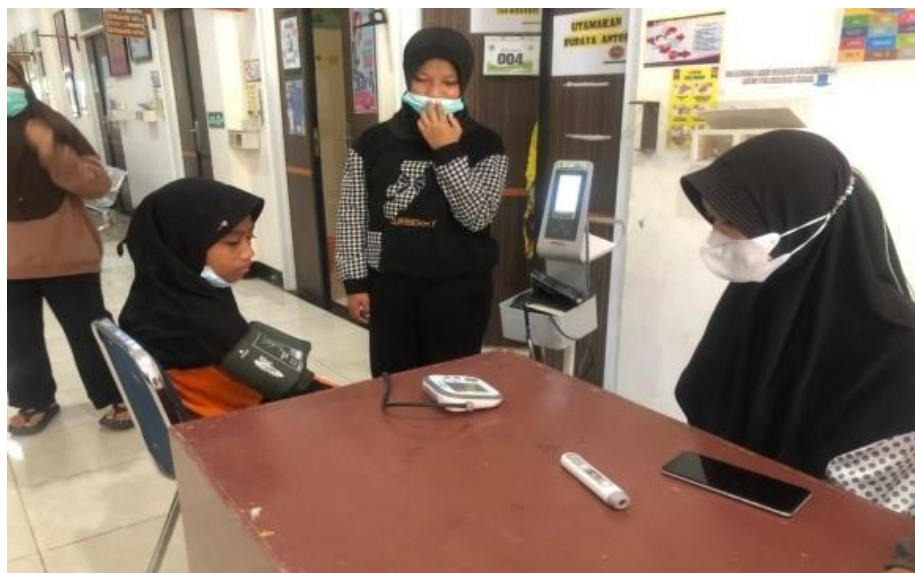
Pemeriksaa Kesehatan oleh Kader Posyandu Milenial