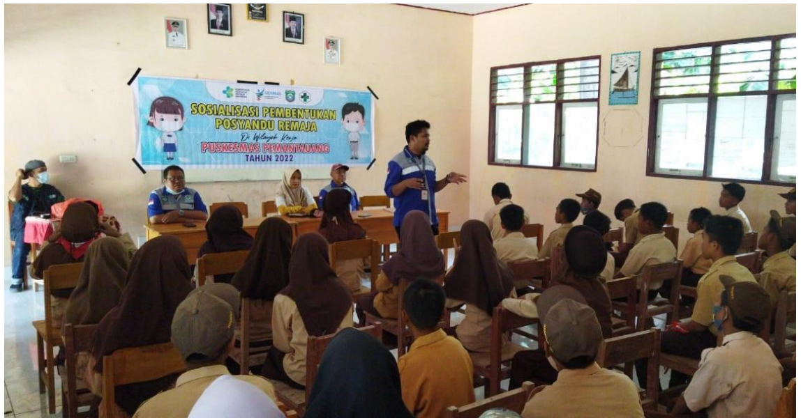
Pembentukan Posyandu Milenial di Sekolah