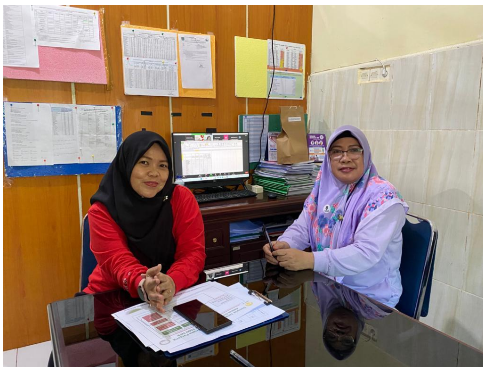
Wawancara Bersama Kepala Bidang Pelayanan Kesehatan