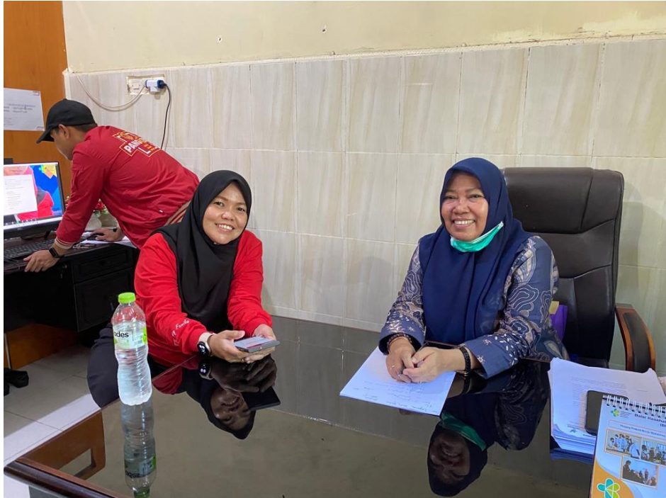
Wawancara Bersama Sub Koordinator Kesehatan Keluarga