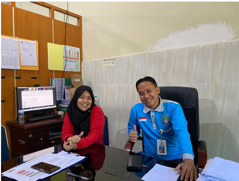
Wawancara Bersama Kepala Bidang Kesehatan Masyarakat