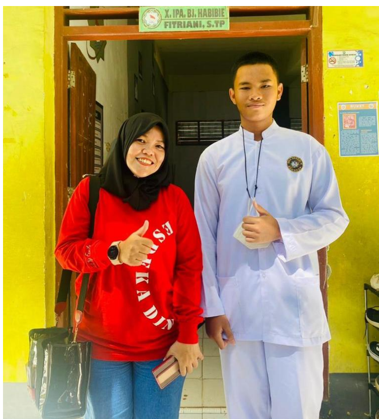
Wawancara Bersama Kader Posyandu Milenial