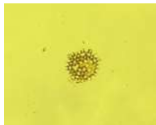
Gambar 4. Fitoplankton dari kelas Chlorophyceae

Adapun jenis-jenis Chlorophyta yaitu, Tetradon , Ulothrix , Chlorella , Pediastrum , Coelastrum dan Actinastrum . Kelompok ini akan tumbuh dengan baik pada kisaran suhu 20°C-35°C (Effendi, 2003).