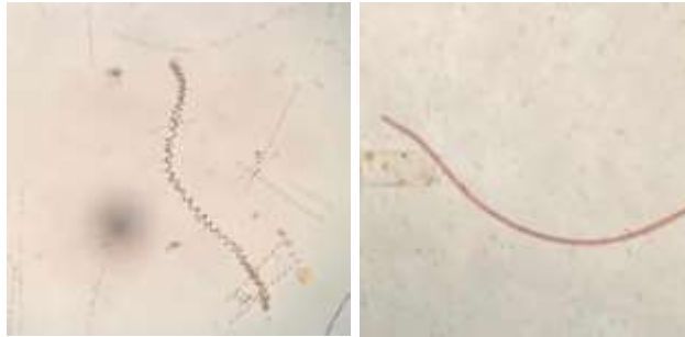
Gambar 3. Fitoplankton dari kelas Cyanophyceae (Aprilia, 2022)

Adapun beberapa jenis genus fitoplankton dari kelas Cyanophyceae yaitu Anabaena , Spirulina , Merismopedia , namun genus yang paling sering ditemukan pada perairan adalah Oscillatoria karena toleran terhadap perairan tercemar bahan organik dan nitrogen yang tinggi.