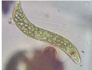
Gambar 5. Fitoplankton dari kelas Euglenophyceae

Jenis-jenis Euglenophyta yang bisa bergerak memiliki flagella yang tertanam dalam kerongkongan anterior, namun ada juga jenis yang memiliki satu flagella yang pendek dan tidak terlihat. Adapun jenis Euglenophyceae yang sering ditemukan yaitu Euglena , Phacus , Strombomonas dan Lepocinclis (Sulastri, 2008)