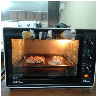
Cangkang Kerang Darah Dikeringkan Menggunakan Oven