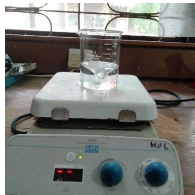
Pembuatan larutan 2