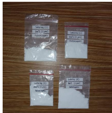
Hidroksiapatit setelah disintering