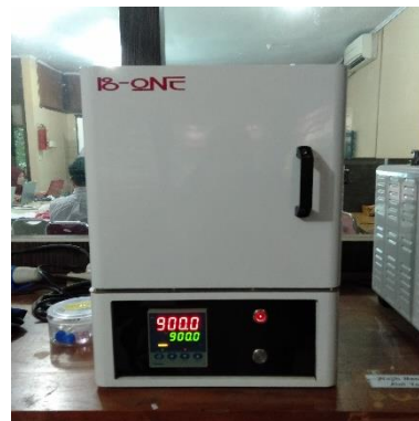
Serbuk cangkang kerang darah dikalsinasi