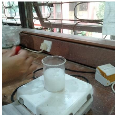
Titrasi larutan 2 ke larutan 1