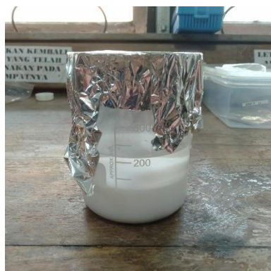
Pengendapan 18 jam