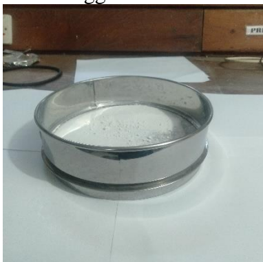
Serbuk Cangkang Diayak