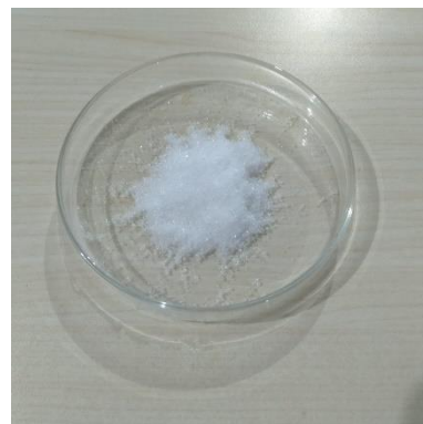
(NH 4 ) 2 HPO 4