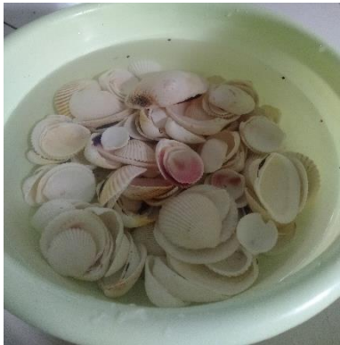
Cangkang Kerang Darah Dibersihkan