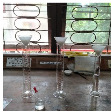
Pencucian 3 kali