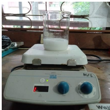
Pembuatan larutan 1