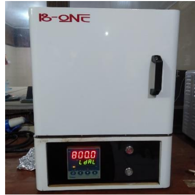
Disintering pada suhu 700°C, 750°C, 800°C dan 850°C