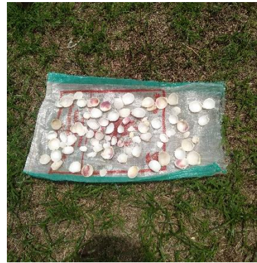
Cangkang Kerang Darah Dikeringkan (Dibawah sinar matahari)