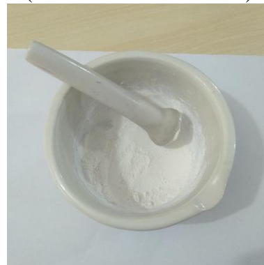
Cangkang Kerang Darah Dihaluskan