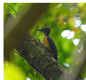
Pelatuk kelabu-sulawesi