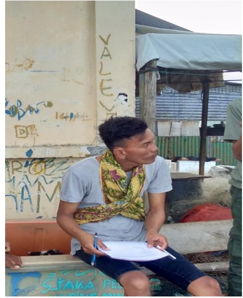
d. Proses pengambilan data