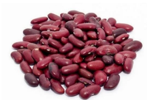
Gambar 01. Kacang Merah

Kacang merah bukan tanaman asli Indonesia, namun banyak dijumpai di Indonesia. Kacang merah, merupakan tanaman asli di lembah Tahuacan, Meksiko (Rukmana, 1994). Kacang merah sebenarnya merupakan kacang buncis tipe tegak (tidak merambat) dan umumnya dipanen polong tua atau biji-bijian saja, sehingga disebut juga Bush bean . Nama umum di pasaran Internasional untuk kacang merah adalah Kidney Beans , Biji kacang merah berbentuk bulat agak panjang, berwarna merah atau merah berbintik-bintik putih. Kacang merah banyak ditanam di Indonesia. Varietas kacang merah yang beredar di pasaran jumlahnya sangat banyak dan beraneka ragam (Rukmana, 1994).