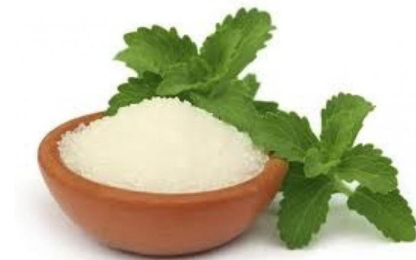
Gambar 03. Gula Stevia

Klasifikasi tanaman Stevia ( Stevia rebaudiana ) berdasarkan Unites States Departement of Agriculture (USDA) sebagai berikut :