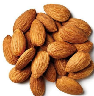
Gambar 02. Kacang Almond

Almond merupakan jenis tree nuts yang populer karena rasanya yang gurih, sedikit manis, dan empuk. Cita rasa gurih pada almond dikarenakan tingginya lemak nabati yang terkandung di dalamnya. Almond mengandung tinggi nutrisi, per 100 gram total lemak (nabati) sebesar 49.9 g, serat pangan 12.2 g, vitamin B (B1, B2, B3, B6) 4.7 mg, vitamin E 25.63 mg, serta tinggi Ca, K, dan P masing masing 269.481, dan 733 mg (USDA, 2016). Tingginya asam oleat dan linoleat pada almond sangat berperan baik dalam tubuh salah satunya menekan kolesterol sehingga baik untuk jantung serta meningkatkan laju aliran darah (Damayanti, 2018).