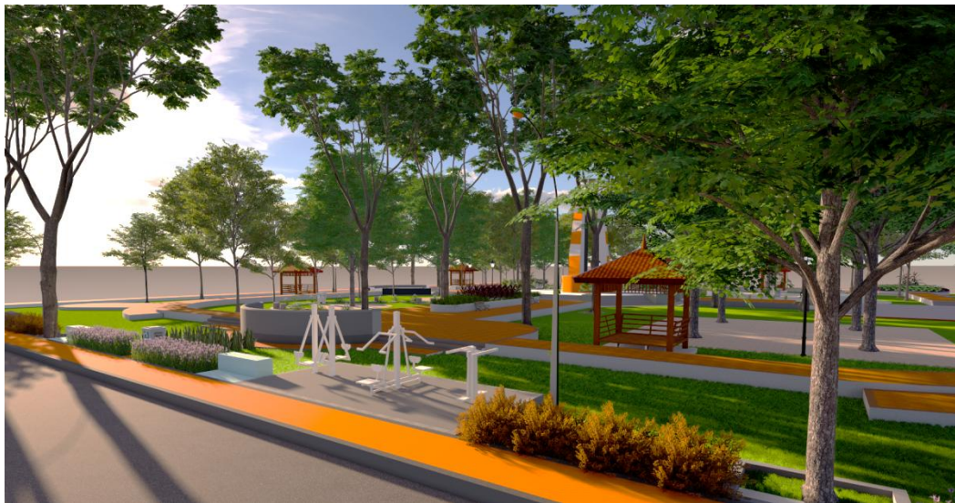
Gambar lampiran 5B. View arena olahraga sesudah revitalisasi