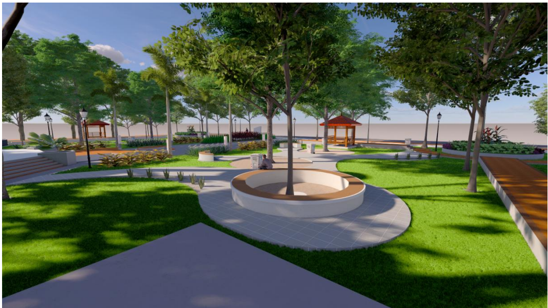
Gambar lampiran 3B. View rest area sesudah revitalisasi