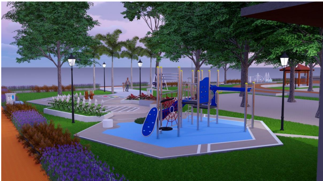
Gambar lampiran 2B. View arena bermain sesudah revitalisasi