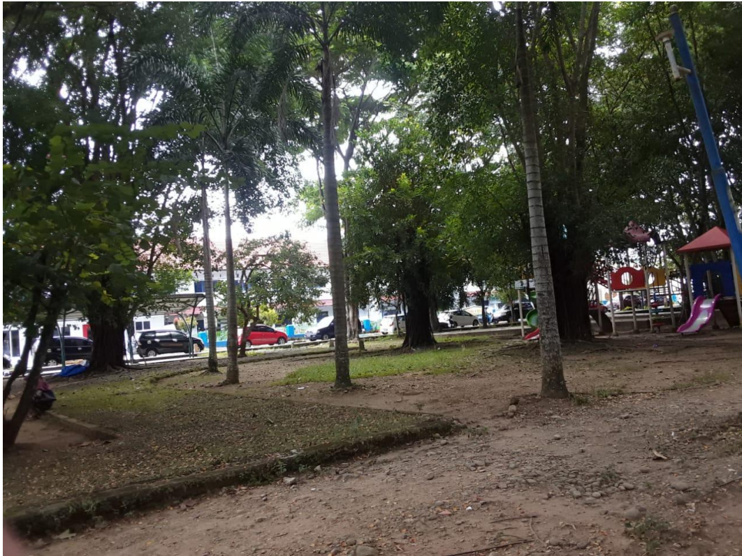
Gambar lampiran 2A. View arena bermain sebelum revitalisasi