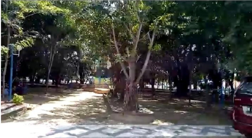
Gambar lampiran 1 A. View akses masuk utama sebelum revitalisasi