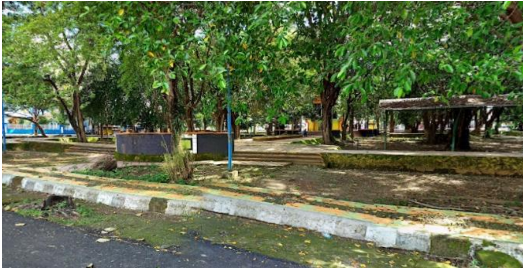
Gambar lampiran 5A. View arena olahraga sebelum revitalisasi