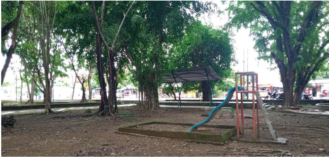
Gambar lampiran 3A. View rest area sebelum revitalisasi