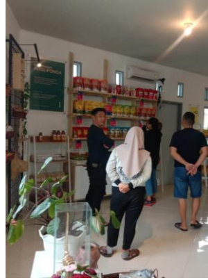
Aktivitas menjelaskan produk kepada Konsumen