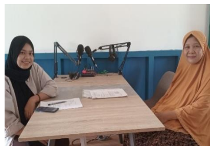
Wawancara dengan informan Pelaku UMKM Keripik Pisang