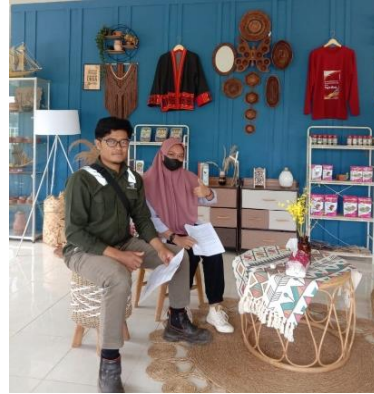
Wawancara dengan informan fasilitator Petani Organik