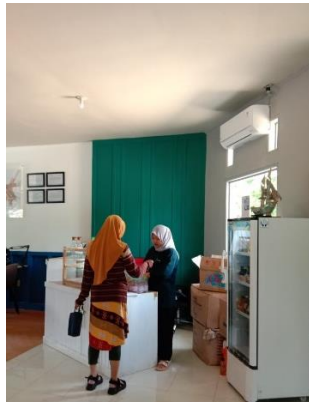
Proses Retur Minuman Herbal