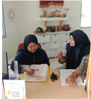
Wawancara dengan Informan Kasir Galeri