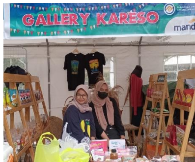
Wawancara dengan Informan Bagian Gudang Galeri