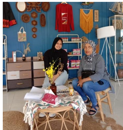
Wawancara dengan informan Pelaku UMKM Minuman Herbal