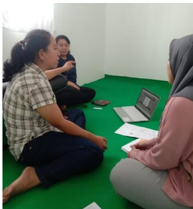
Wawancara dengan informan anggota Karya Nusantara Konsultan (KNK)