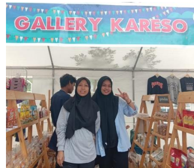
Wawancara dengan Informan Bendahara BUMDESMA