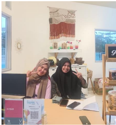
Wawancara dengan informan Manajer Galeri