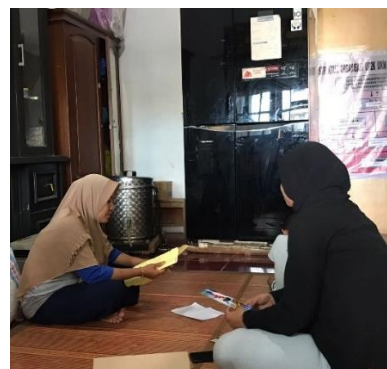
Wawancara dengan Informan Pelaku UMKM Keripik Pangkilang