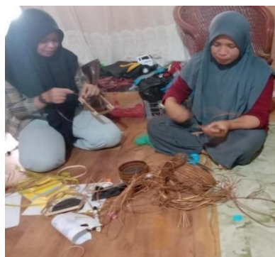
Wawancara dengan Informan Pelaku UMKM Kerajinan Teduhu