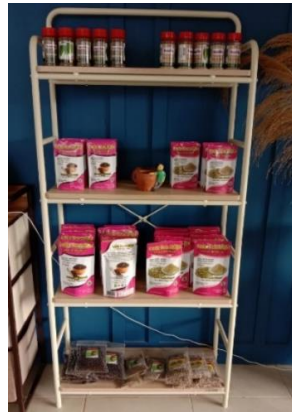
Produk Kemasan Premium