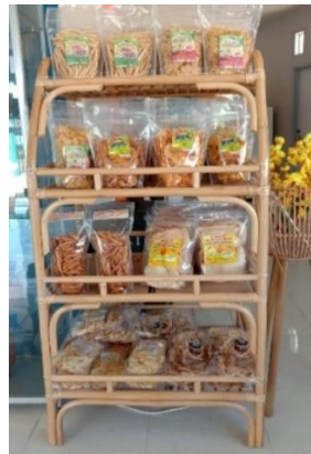
Produk Kemasan sederhana