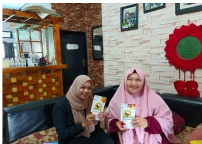
Wawancara dengan informan Pelaku UMKM Jahe Merah