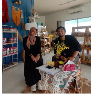
Wawancara dengan Informan Direktur BUMDESMA