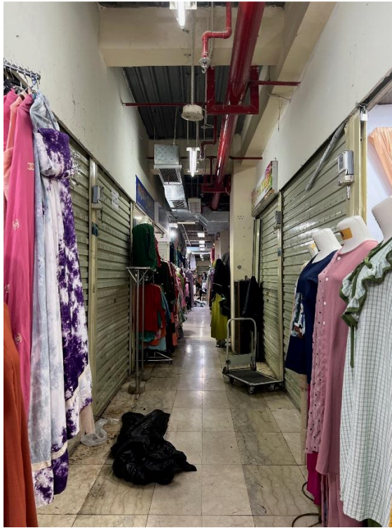
Lampiran 4. Kios terlihat sepi pengunjung