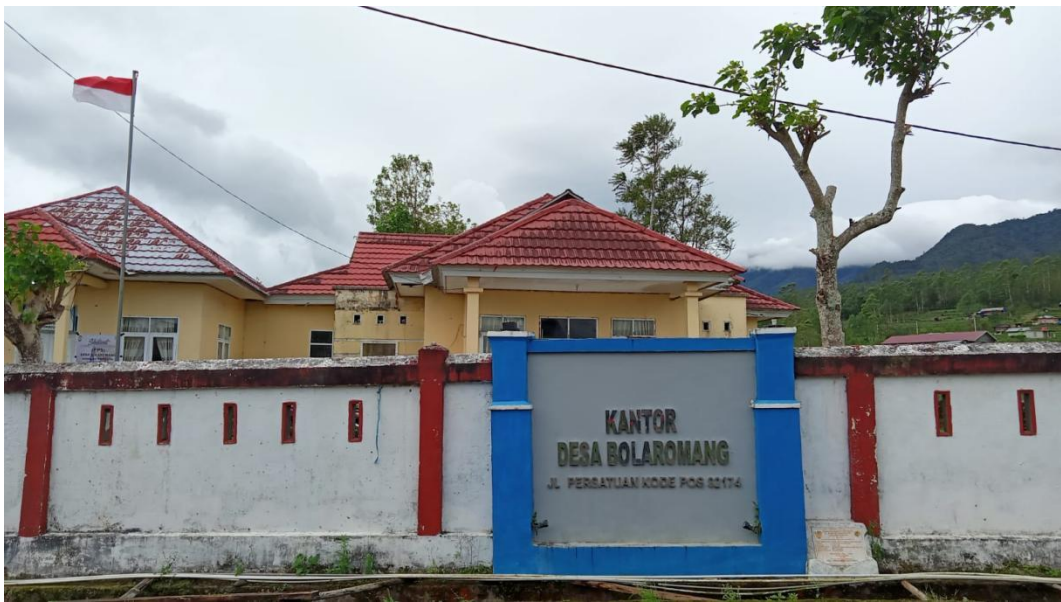
Gambar Kantor Desa Bolaromang