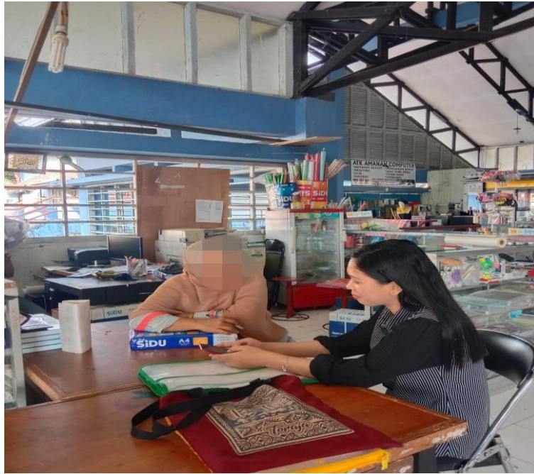
Gambar 7.5 Wawancara bersama Informan SA