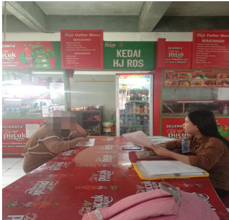
Gambar 7.4 Wawancara Bersama Informan HN