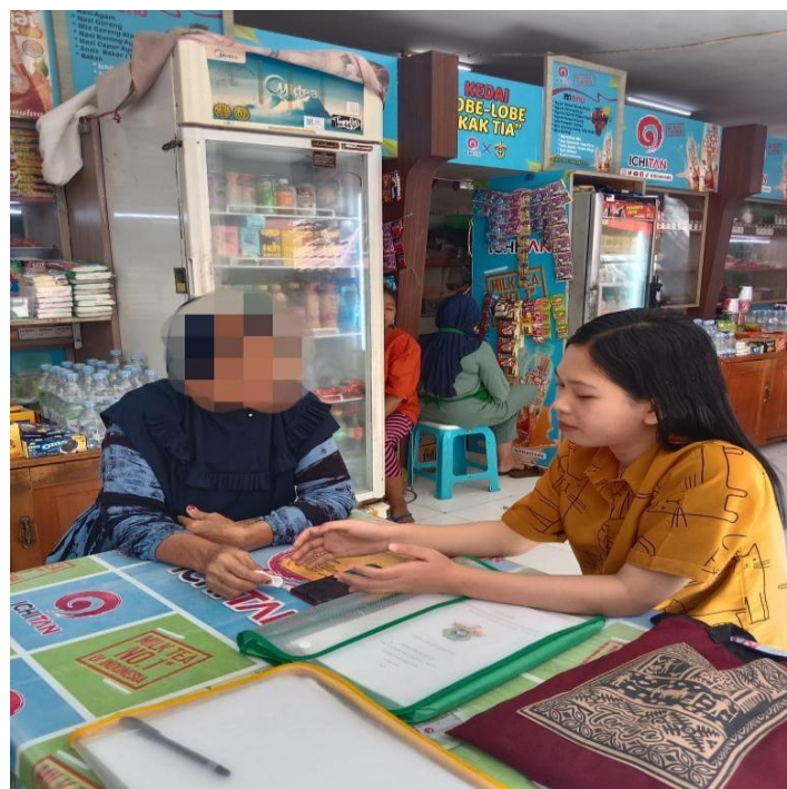
Gambar 7.2 Wawancara bersama Informan RH