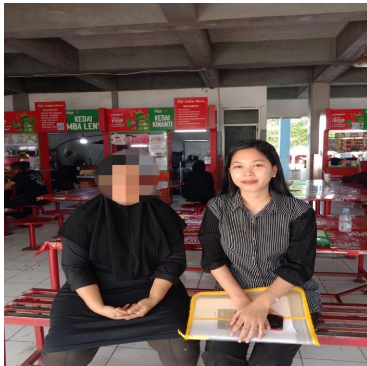
Gambar 7.6 Wawancara bersama Informan AN