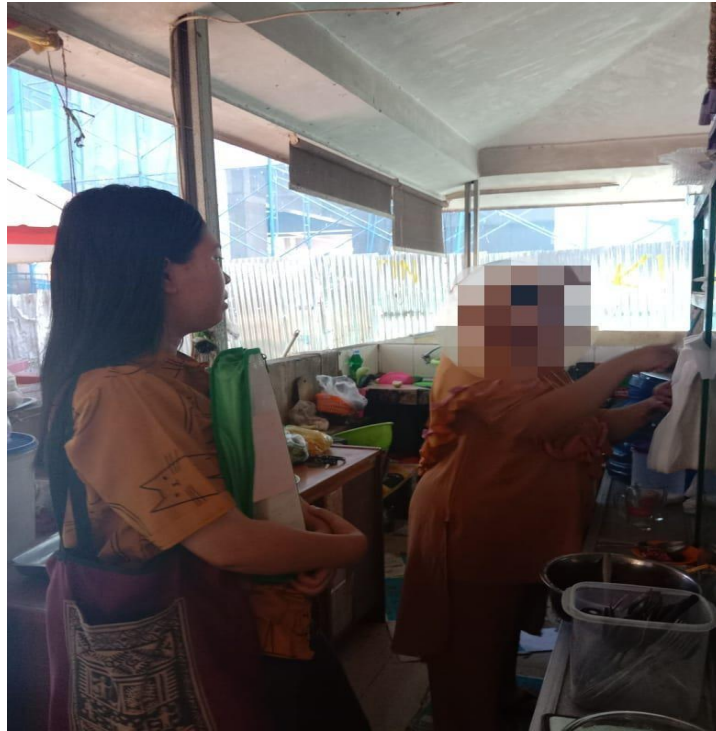
Gambar 7.3 Wawancara Bersama Informan HM