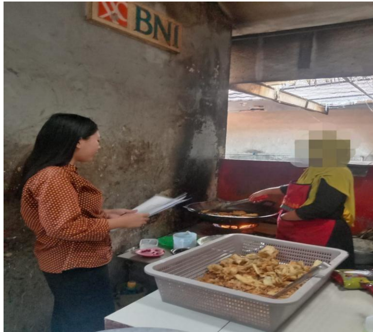
Gambar 7.1 Wawancara bersama Informan WD