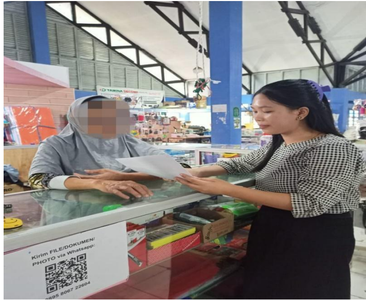
Gambar 7.7 Wawancara Bersama Informan N