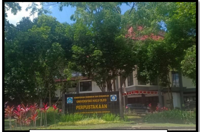
Perpustakaan Universitas Halu Oleo