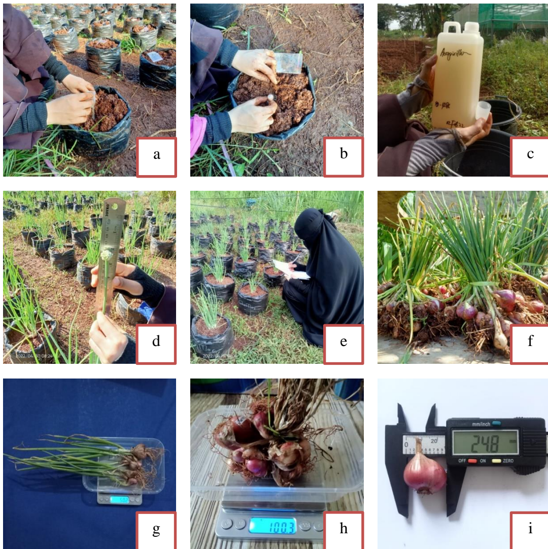
Gambar Lampiran 3. Tahapan penelitian di lapangan. Aplikasi mikoriza dan penanaman umbi (a-b), aplikasi Azospirillum sp. (c), pengukuran tinggi tanaman (d), pengamatan jumlah daun (e), panen (f) penimbangan bobot umbi basah (g), penimbangan bobot umbi kering (h), pengukuran diameter umbi (i).