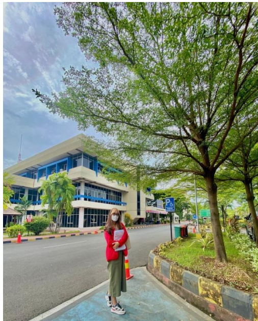
Gambar 6.2 Gambar Gedung KPP Pratama Makassar Utara