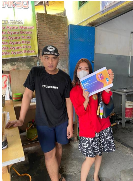
Gambar 6.5 Gambar Setelah Menyebar Kuesioner dan Wawancara kepada UMKM Wilayah KPP Pratama Makassar Utara