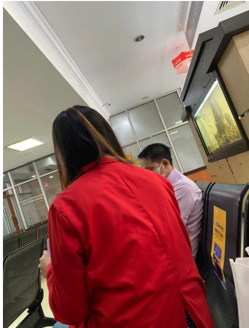
Gambar 6.4 Gambar Penyebaran Kuesioner kepada Wajib Pajak UMKM KPP Pratama Makassar Utara