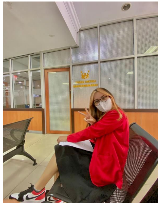
Gambar 6.6 Gambar Menunggu Wajib Pajak UMKM KPP Pratama Makassar Utara