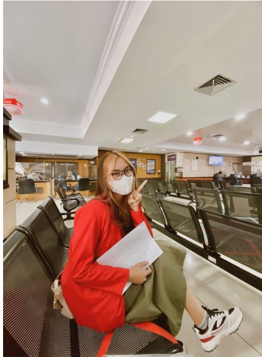
Gambar 6.3 Gambar Menunggu Wajib Pajak UMKM KPP Pratama Makassar Utara