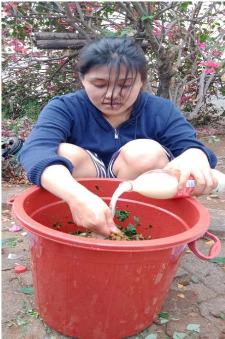
c) pencampuran bahan cair dan bahan kering