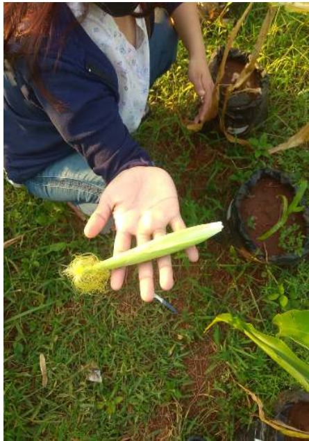
j) pemanenan baby corn