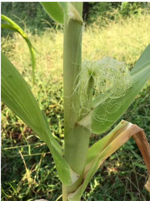
g) tongkol jagung yang baru keluar