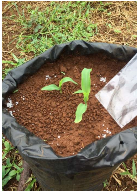
b) pemberian pupuk dasar pada tanaman