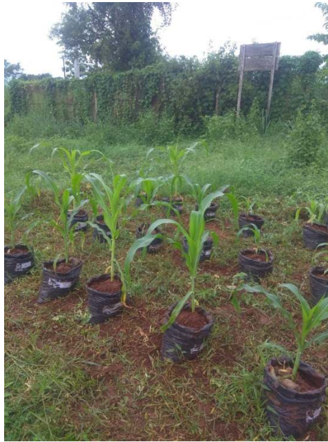
f) pertumbuhan setiap minggunya