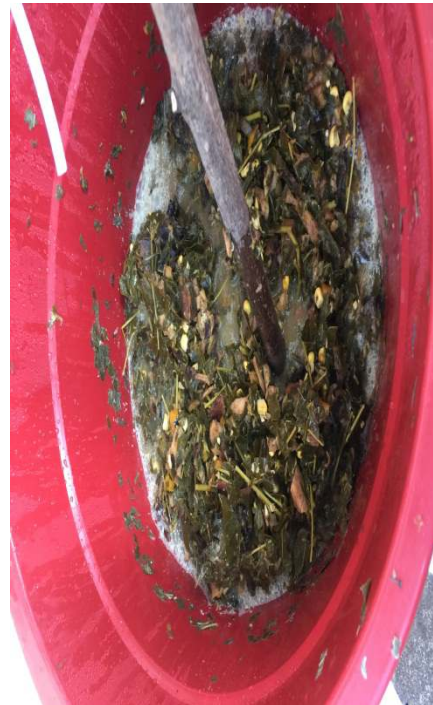
d) pengadukan semua bahan kemudian ditutup rapat dan disimoan selama 1bulan