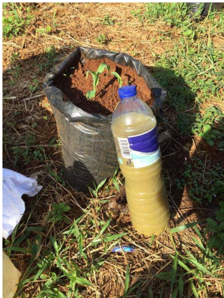
c) pemberian POC yang diberikan setiap minggunya