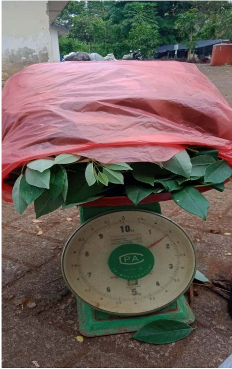
a) Penimbangan bahan yang akan digunakan