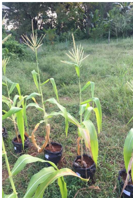
h) sehari sebelum pemanenan