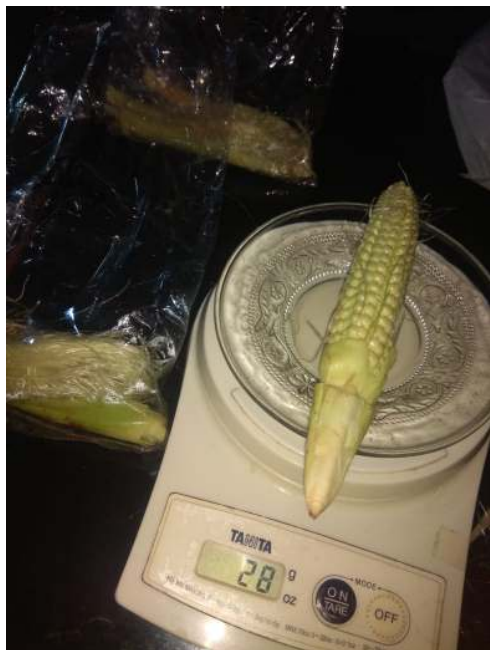
ii) Babycorn hasil panen