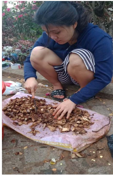
b) pencacahan bahan agar menjadi lebih kecil dan cepat terurai