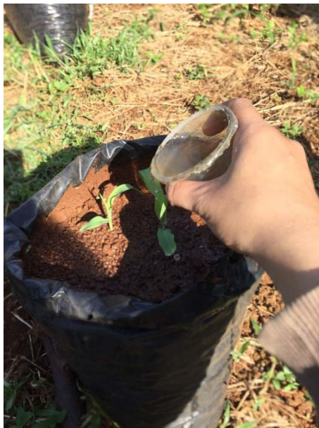
d) penyiraman POC pada tanaman jagung