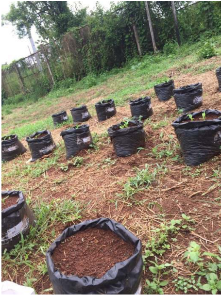
a) Minggu pertama penanaman