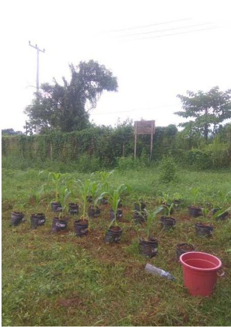
e) perawatan lingkungan dengan pecambutan gulma