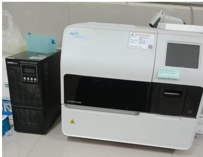
Alat pengukuran waktu PT dan aPTT Sysmex coagulation Analyzer CA-600 series