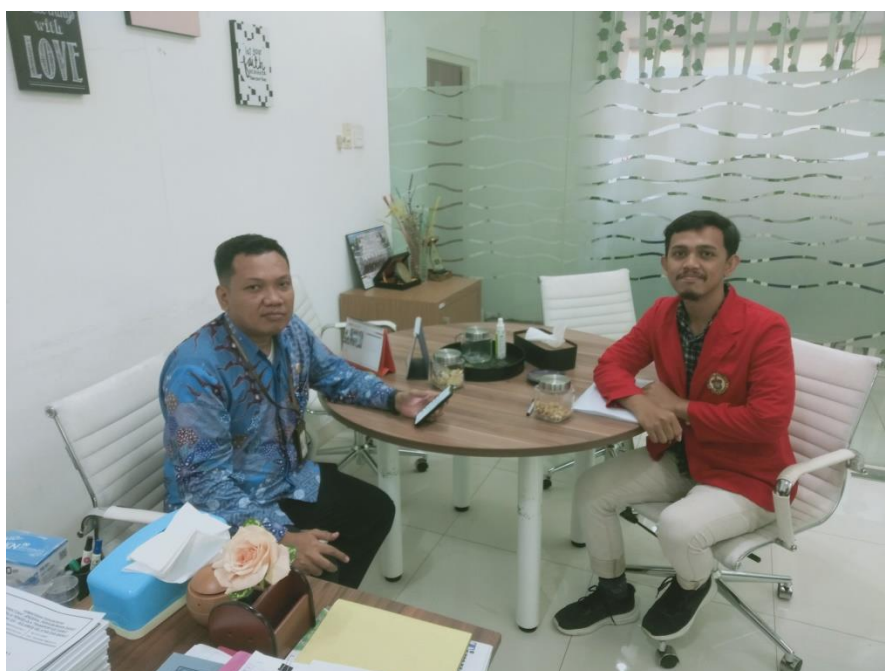
Wawancara dengan Kepala Seksi Lalu Lintas dan Angkutan Jalan Balai Pengelola Transportasi Darat (BPTD) wilayah XIX Provinsi Sulselbar