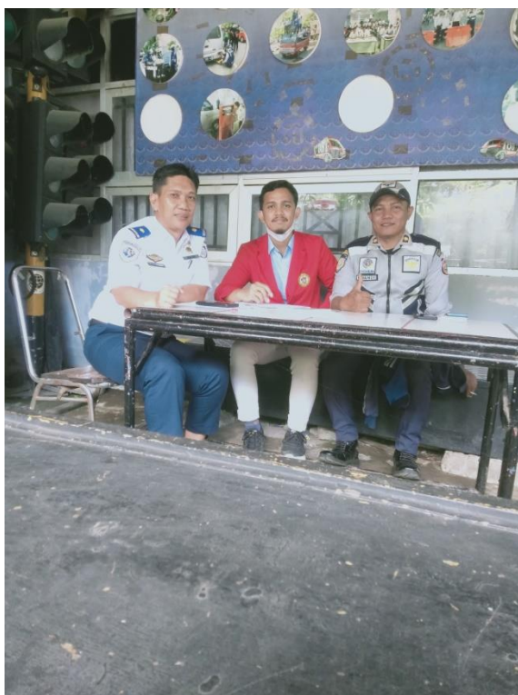
Wawancara dengan Kepala Seksi Pemeliharaan Sarana & Prasarana Perhubungan Dinas Perhubungan Kota Makassar