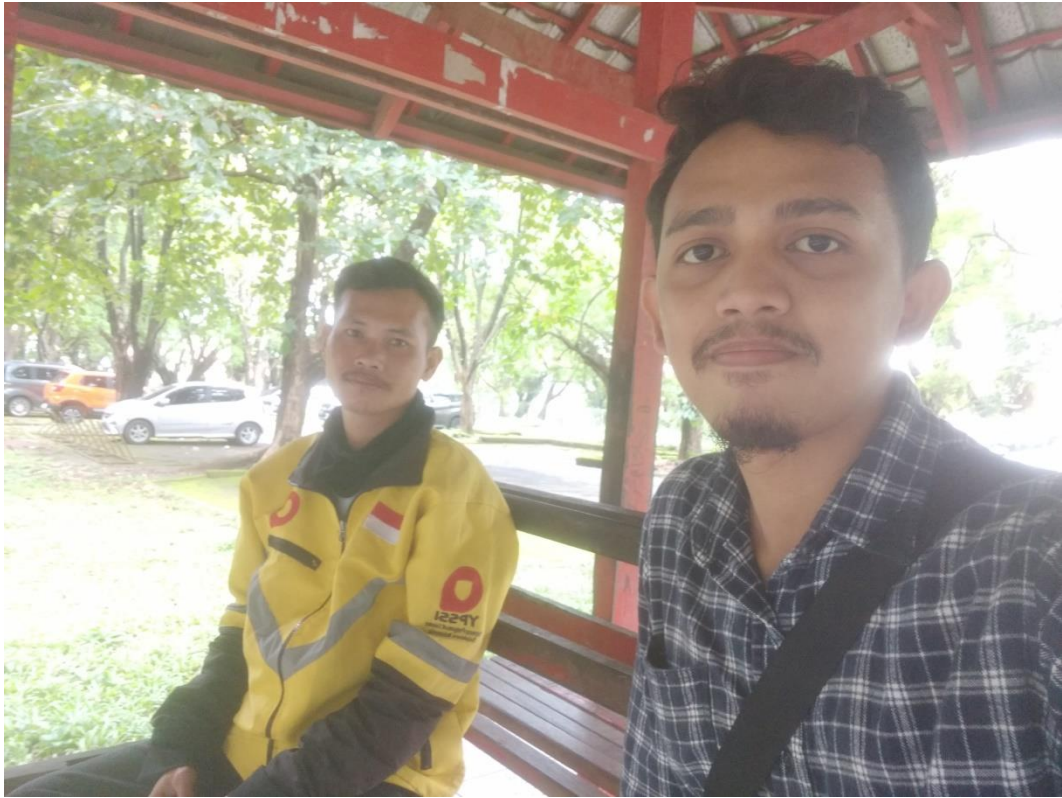
Wawancara dengan masyarakat Kota Makassar