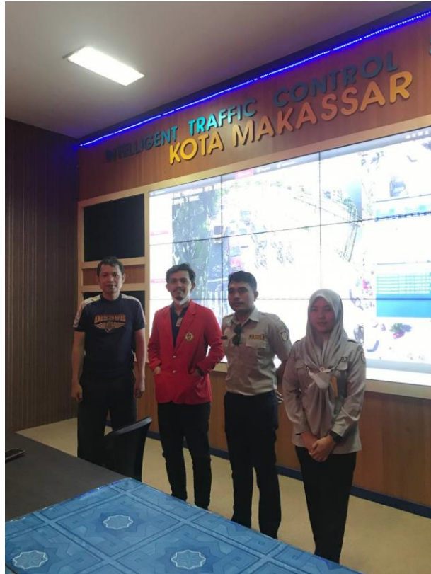
Wawancara dengan staff pegawai Bidang Pemeliharaan Sarana & Prasarana Perhubungan Dinas Perhubungan Kota Makassar