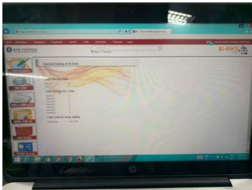
(Tampilan awal BI-RMS)