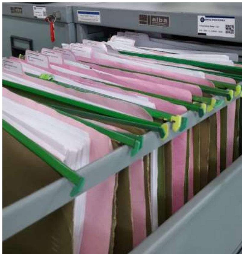
(Penataan Folder Arsip Dinamis Aktif dalam Laci Filing Cabinet)