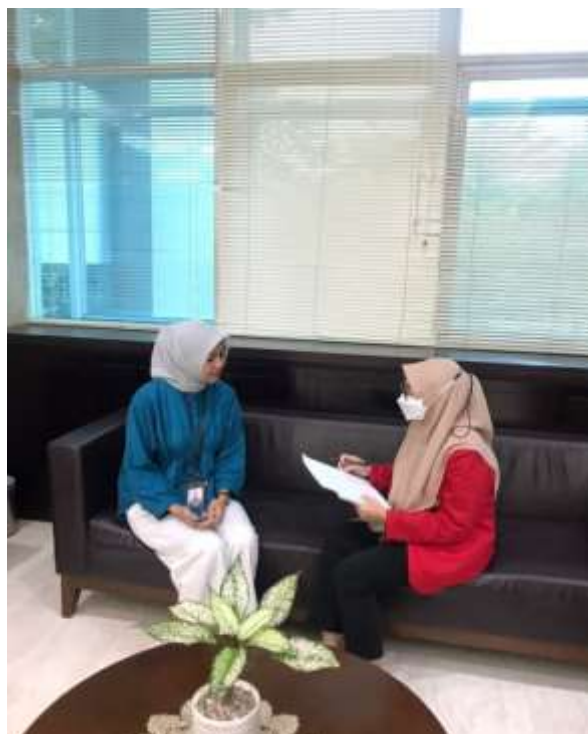
(Wawancara dengan swakelola di KPw Bank Indonesia Provinsi Sulawesi Selatan)