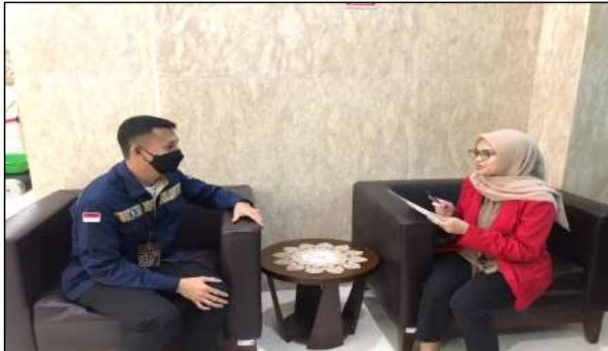
(Wawancara dengan staff/pegawai di KPw Bank Indonesia Provinsi Sulawesi Selatan)