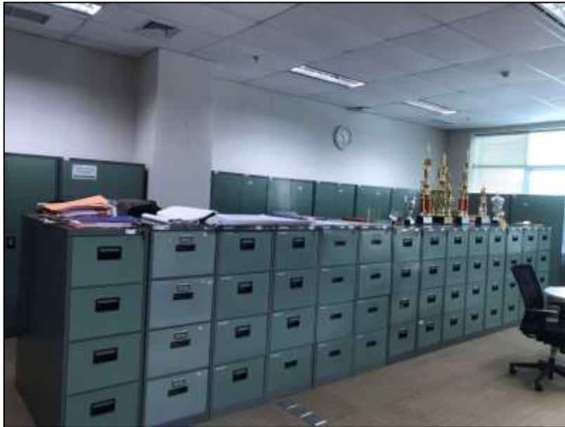
(Arsip yang ditata dalam folder disimpan dalam filing cabinet )