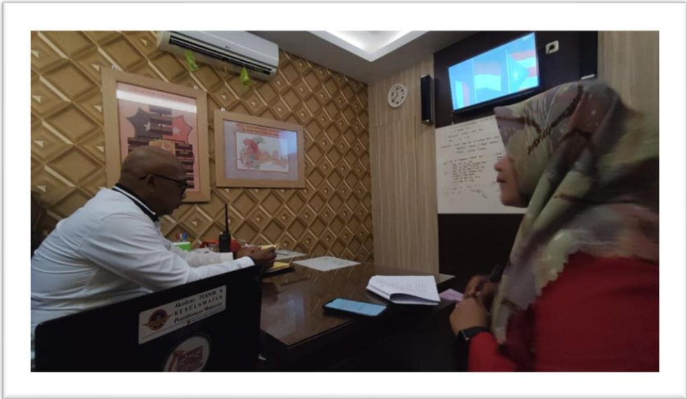
WAWANCARA KANIT RESKRIM POLSEK TALLO