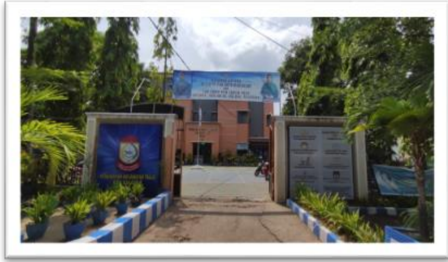
KANTOR KECAMATAN TALLO KOTA MAKASSAR