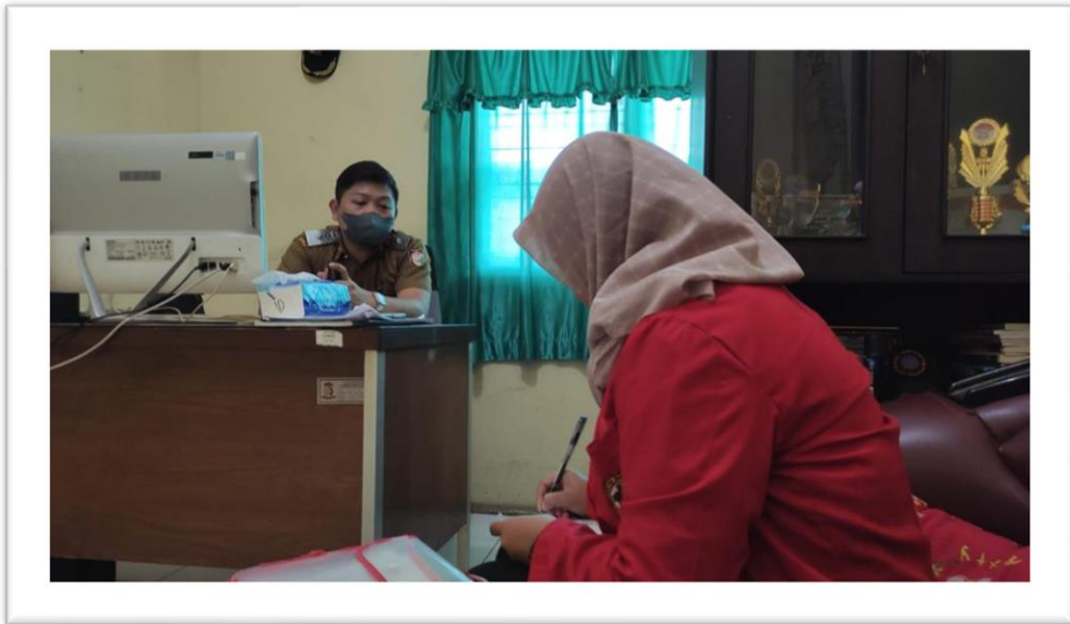
WAWANCARA LURAH KALUKUANG