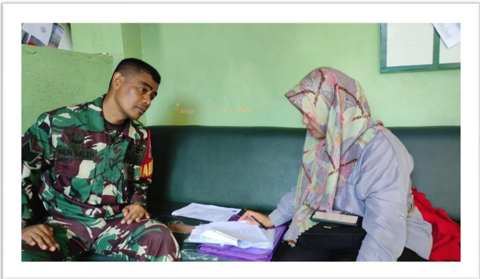
WAWANCARA KORAMIL 14-08/02 TALLO