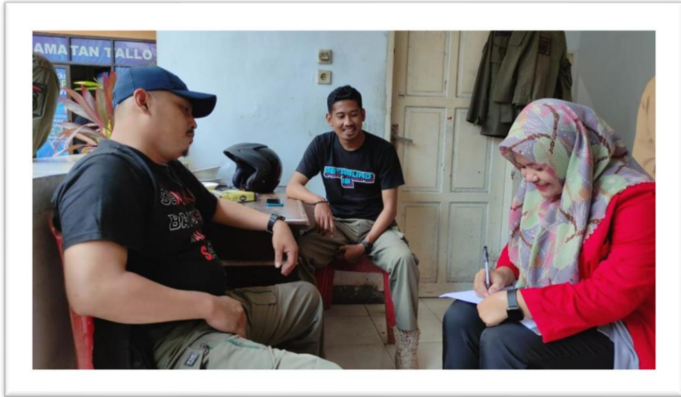
WAWANCARA SATPOL PP