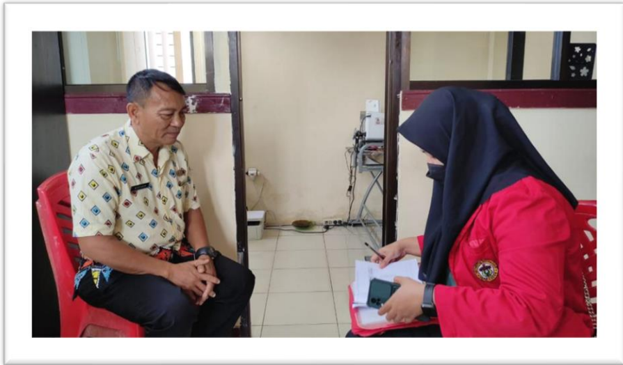
WAWANCARA KASI PEMERINTAHAN, KETENTRAMAN DAN KETERTIBAN UMUM KECAMATAN TALLO KOTA MAKASSAR