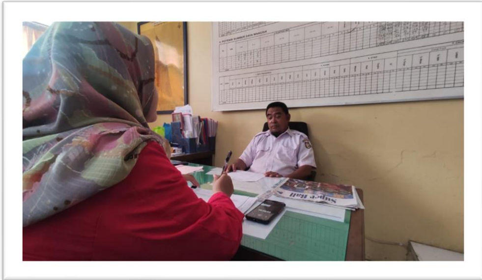
WAWANCARA KASI PEMERINTAHAN KELURAHAN BUNGA EJA BERU