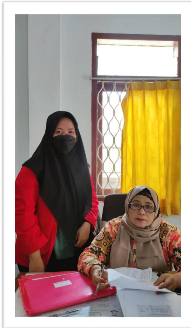
WAWANCARA KASI PEMERINTAHAN KELURAHAN TAMMUA