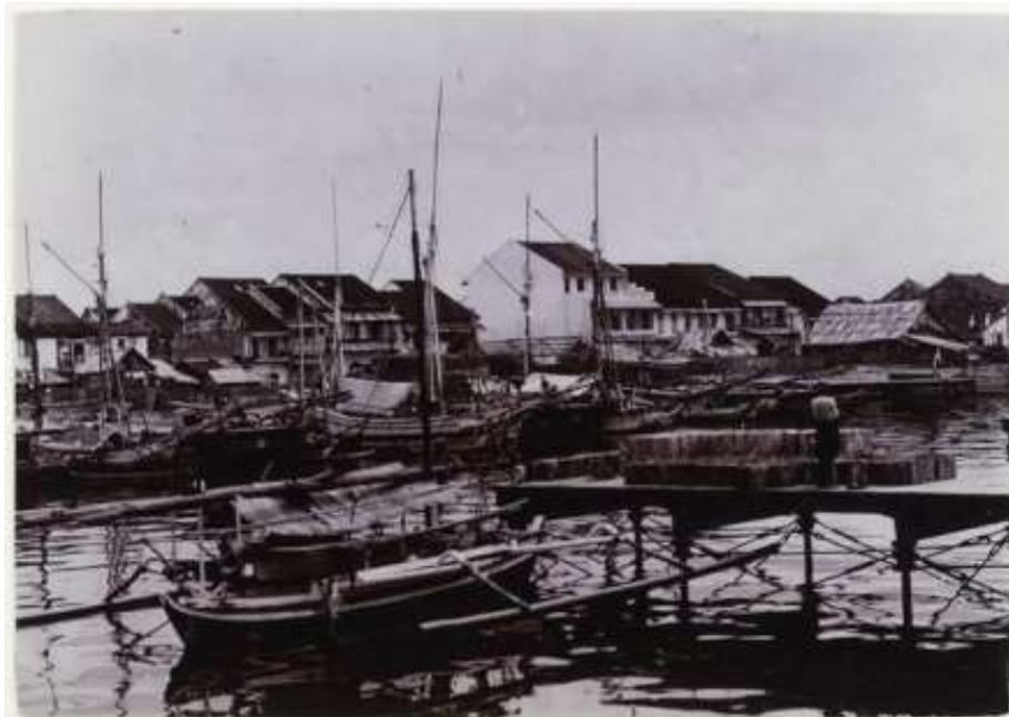
Kondisi Pelabuhan Makassar pada abad 19 (KITLV)