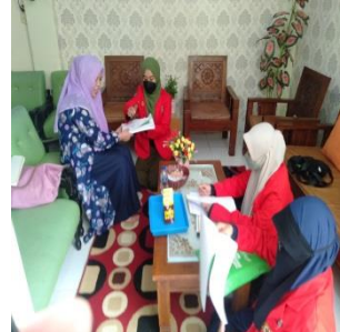
Panti Asuhan At-Tiin