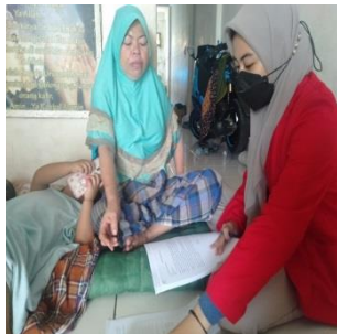
Panti Asuhan At-Taqwa