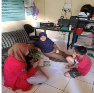
Panti Asuhan Nurul Akbar