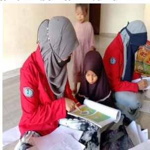
Panti Asuhan Nur Riskullah