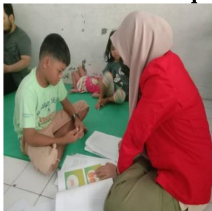
Panti Asuhan Nurul Amal