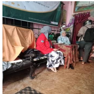
Panti Asuhan Nurul Qadri