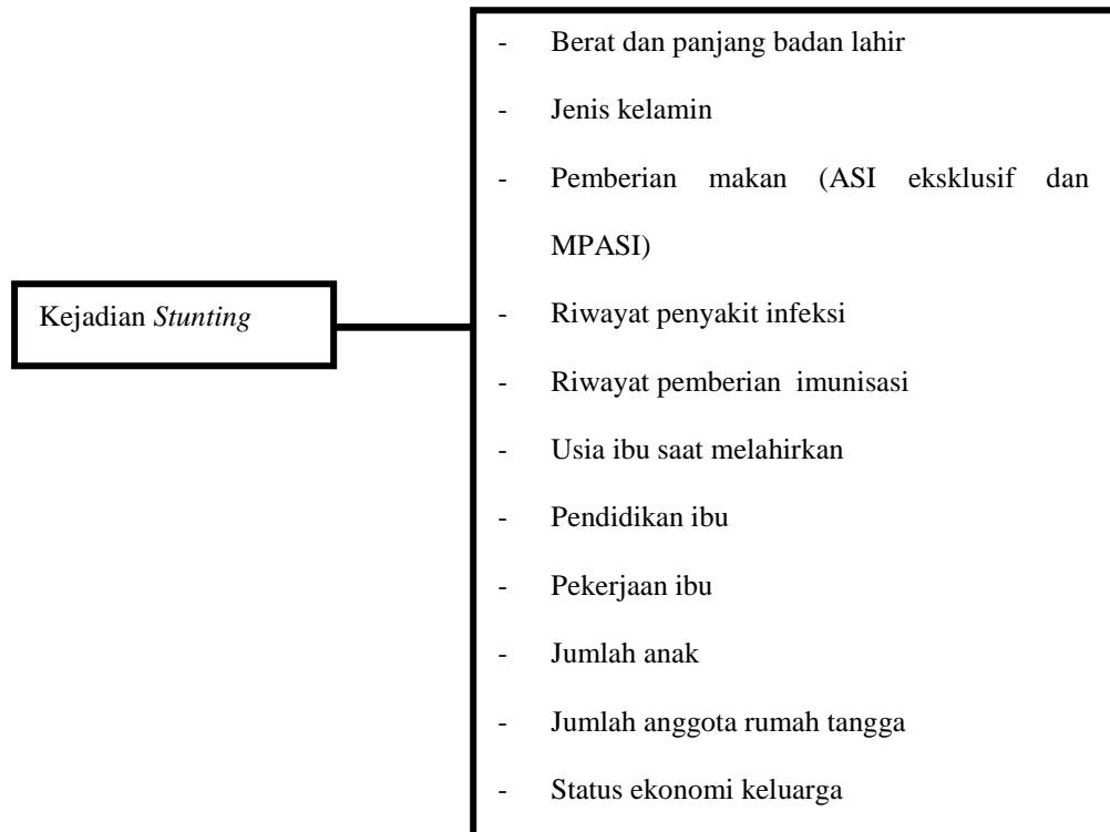
Bagan 3.1. Kerangka Konsep

Untuk memudahkan pemahaman maka secara sederhana kerangka konsep dari penelitian ini digambarkan sebagai berikut.