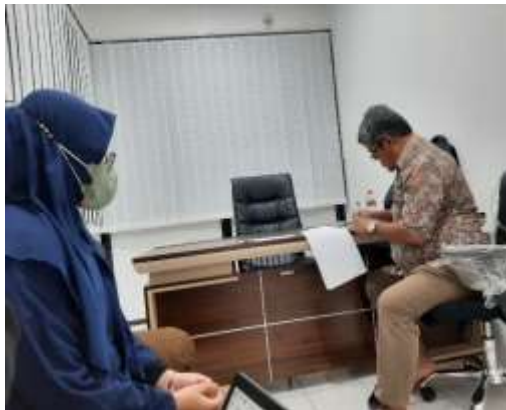
Gambar 3 Uji Materi 1