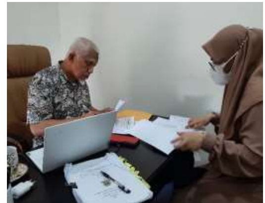
Gambar 4 Uji Materi 2