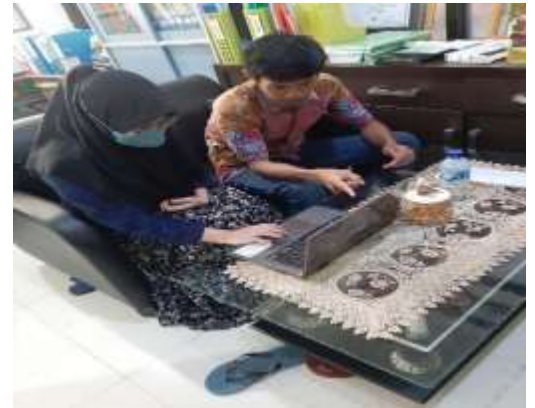
Gambar 2 Uji Media