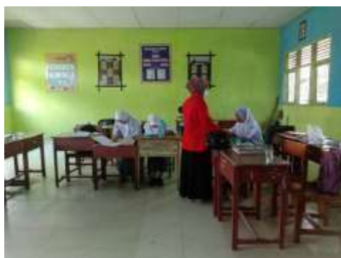
Gambar 5 Uji Kelompok Kecil