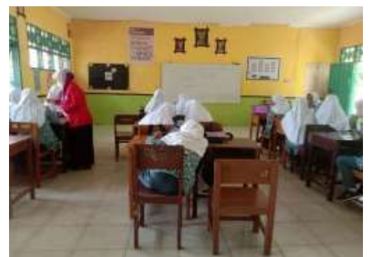
Gambar 6 Uji Kelompok Besar