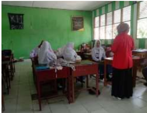
Gambar 1 Study Pendahuluan