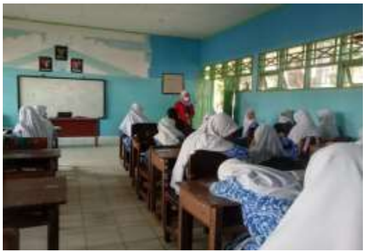
Gambar 7 Pre dan Post Test