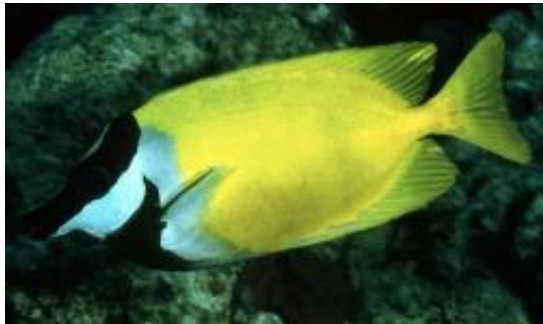
Gambar 3. Ikan famili Siganidae ( Siganus vulpinus ) (Green & Bellwood, 2009)

Hampir semua ikan baronang (kecuali Siganus canaliculatus dan S. lineatus ) merupakan kelompok grazers , dimana mereka tidak mengikis atau menggali substrat karang ketika sedang makan (Husain, 2012).