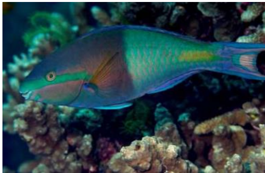
Gambar 2. Ikan famili Scaridae ( Scarus flavipectoralis ) (Green & Bellwood, 2009)

Famili Scaridae memiliki 88 spesies yang tergolong ke dalam 10 genera yaitu: Bolbometopon , Calotomus , Cetoscarus , Chlorurus , Cryptotomus , Hipposcarus , Leptoscarus , Nicholsina , Scarus dan Sparisoma (Nelson, 2006).