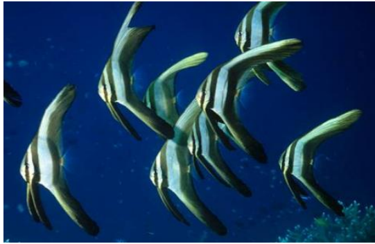
Gambar 4. Ikan famili Ehippidae ( Platax teira ) (Green & Bellwood, 2009)