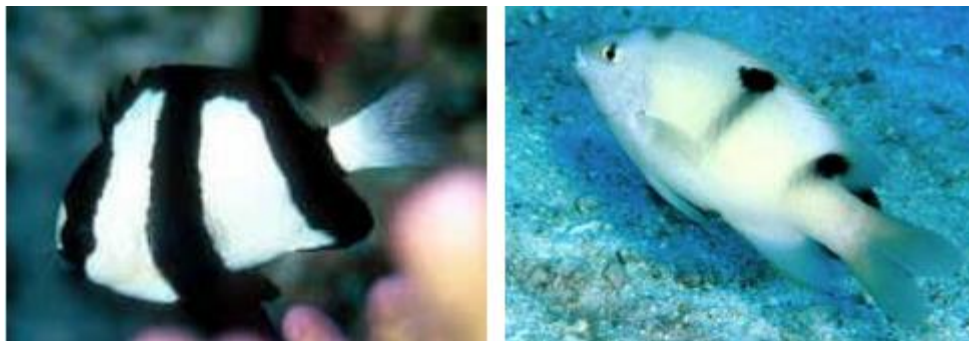
Gambar 5. Ikan famili Pomacentridae ( Dascyllus auranus ) (kanan) dan ( Dischistodus perspicillatus ) (kiri) (Nelson, 2006)

Famili Pomacentridae merupakan satu kelompok ikan karang tropis yang memiliki karakteristik menarik. Daya tariknya tidak hanya dari corak warnanya yang cerah dan bentuknya yang agak pipih, namun juga dari jumlah dan aktifitasnya. Menurut March (2004), secara umum ikan famili Pomacentridae ini mempunyai banyak genus, dengan badan pipi dan nampak dari samping bulat, ikan ini berukuran kecil yang terbanyak di terumbu karang (kelimpahan individu) sedangkan makanan dari ikan ini yaitu plankton, invertebrate dan alga. Selain banyak terdapat di daerah terumbu karang, tetapi jenis ikan ini juga dapat hidup pada lingkungan dengan kondisi yang beragam (Zulfianti, 2014).