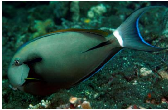
Gambar 1. Ikan famili Acanthuridae ( Acanthurus nigricauda ) (Green & Bellwood, 2009)

karang (Randall et al. 1990). Banyak spesies ikan butana (Acanthuridae), termasuk semua spesies Zebrasoma dan Acanthurus merupakan kategori grazer/detritivore yang mengkonsumsi alga kelompok epilithic algae matrix , sedimen dan beberapa material hewan, perilaku makan mereka tidak mengikis atau menggali substrat karang ketika sedang makan (Husain, 2012).